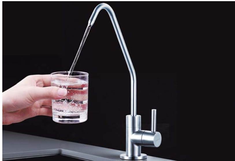
每天保证正确的饮水量,你的大脑思维和身体机能都会焕然一新。

水除了是生命体主要组成部分外,还参与人体新陈代谢的全过程,是体内营养物质运输和代谢废物排出的唯一载体,还是人体所需的七大类营养素之首,又是多种微量元素的重要来源。