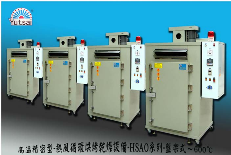
高溫精密型-熱風循環烘烤乾燥設備-HSAO系列-盤架式~600°C