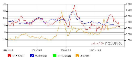
M1-M2 增速差与上证综合指数走势图

4. 民航局 | 5月11日，民航局召开民航北斗工作领导小组第二次会议强调，要加速推进北斗在民航领域的应用，加大以北斗为核心的民航自主创新技术应用研发，进一步加快推进北斗等国家重大专项在民航领域落地。下一步，民航局将不断加大工作力度，加快推进北斗国际民航标准化工作，加速推进北斗在通用航空、运输航空等领域的应用。