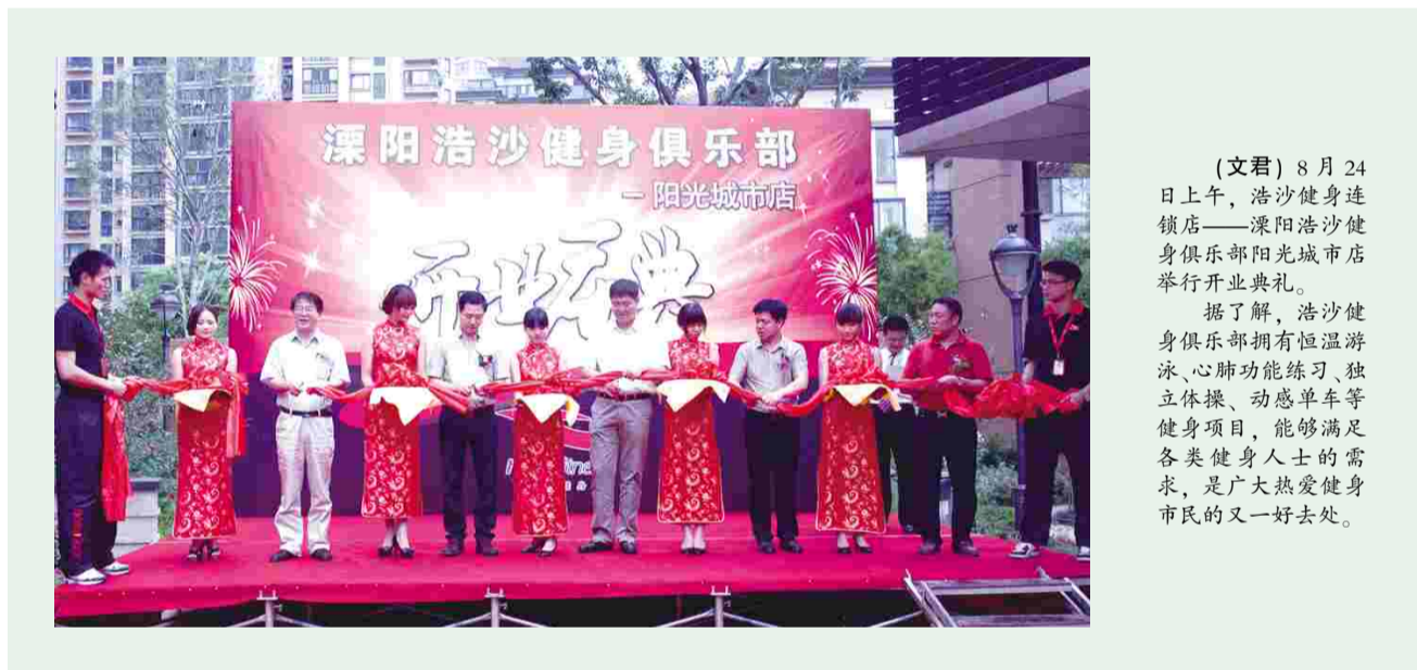
(文君) 8月24日上午，浩沙健身连锁店——溧阳浩沙健身俱乐部阳光城市店举行开业典礼。据了解，浩沙健身俱乐部拥有恒温游泳、心肺功能练习、独立体操、动感单车等健身项目，能够满足各类健身人士的需求，是广大热爱健身市民的又一好去处。

活动中，惠寒支教苏州二队的队员们主动热情的服务，让社区的老人和小孩充分感受到了艺术的魅力。从合唱排练到模特步走秀，从乐器演奏到美声演唱，队员们带去的形式新颖的各项活动，不仅丰富了社区的文化生活，熏陶了居民们的情操，也让学生们的风采得到了极大的彰显。与此同时，队员们传递知识、传递爱心、传递文明的举动，也受到了社区居民的高度赞扬。