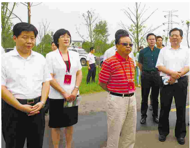
(文君) 24 日下午,在常州的全国人大代表在常州市委副书记戴源等领导的陪同下,来我市曹山农业现代示范区视察调研现代农业。我市市长苏江华,人大常委会副主任周建明,市委常委、副市长夏国浩也陪同视察调研。