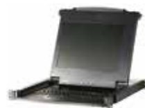
LCD控制端 CL1000M x 1