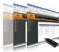
Control Center Over the NET™ 管理软件 CC2000 x 1