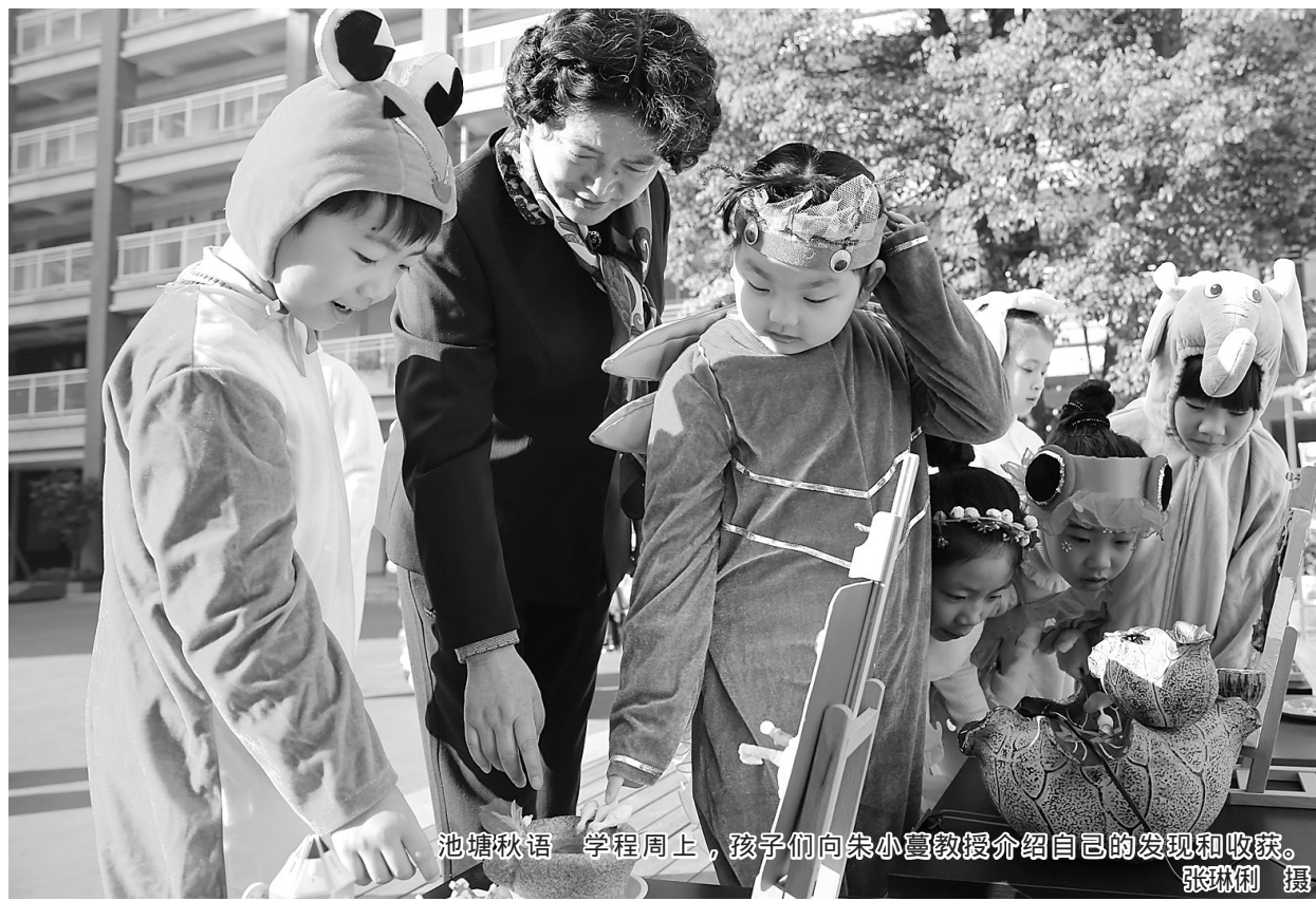
池塘秋语 学程周上，孩子们向朱小蔓教授介绍自己的发现和收获。张斌刚 摄

活动性学程基于时间维度划分，包括宏观、微观两个层面。宏观层面，是学生在拉小六年学习的整体设计和规划，抑或是某一学年或学期的课程学习；微观层面，是学程周的课程学习，抑或是某一节课、甚至是一节课某一环节的学习。基于活动空间维度划分，包括基于课堂学习现场的生活性学程和基于实践活动现场的活动性学程，更是拉小创造性开展