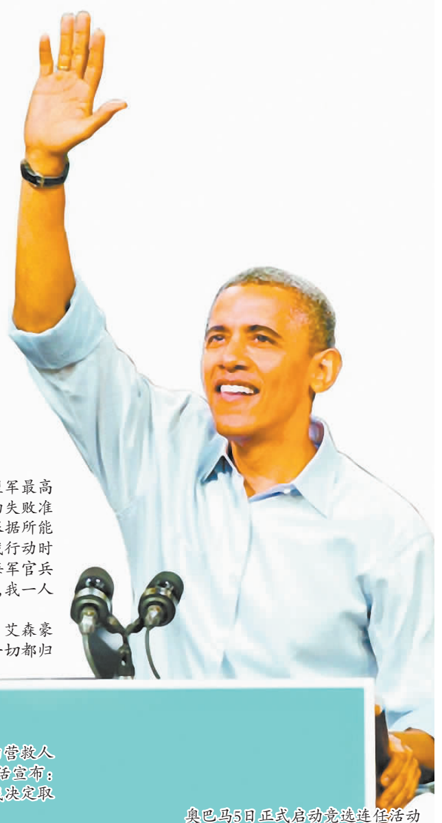
奥巴马5日正式启动竞选连任活动

美国前总统吉米·卡特在其下令的营救人质行动失败后,也曾发表全国广播讲话宣布:“是我决定采取这次营救活动的,也是我决定取消的,责任完全在我。”