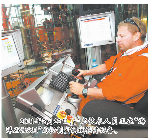
2011年5月22日,一名技术人员正在“海洋石油981”的控制室调试钻井设备。

“海洋石油981”正式开钻,标志着我国海洋石油工业的“深水战略”迈出了实质性的步伐,也标志着我国能源装备技术和船舶工业技术迈上了新的台阶,以海洋石油981为旗舰的中国海油“深水舰队”正式起航,将开启我国海洋石油工业发展的新篇章。