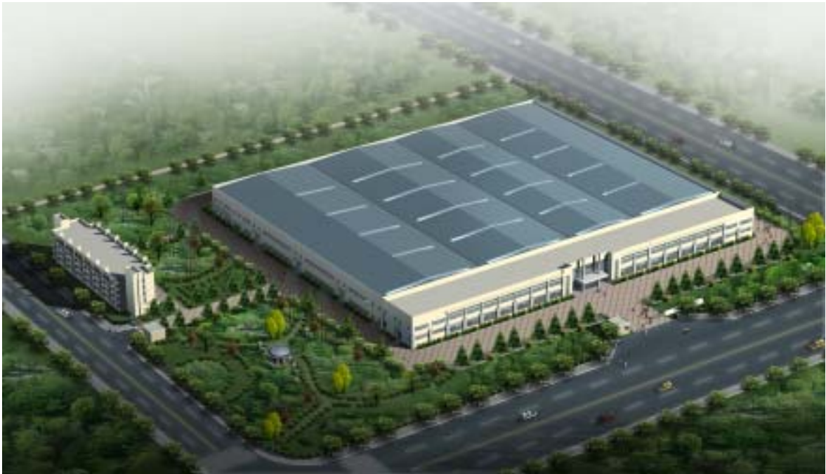
东睦（天津）粉末冶金有限公司效果图

有关东睦（天津）粉末冶金有限公司的公告，详见 2004 年 5 月 26 日、2004 年 6 月 28 日、2004 年 8 月 29 日公布在上海证券交易所指定网站上的公告，并同时刊登在了《上海证券报》、《中国证券报》和《证券时报》上。