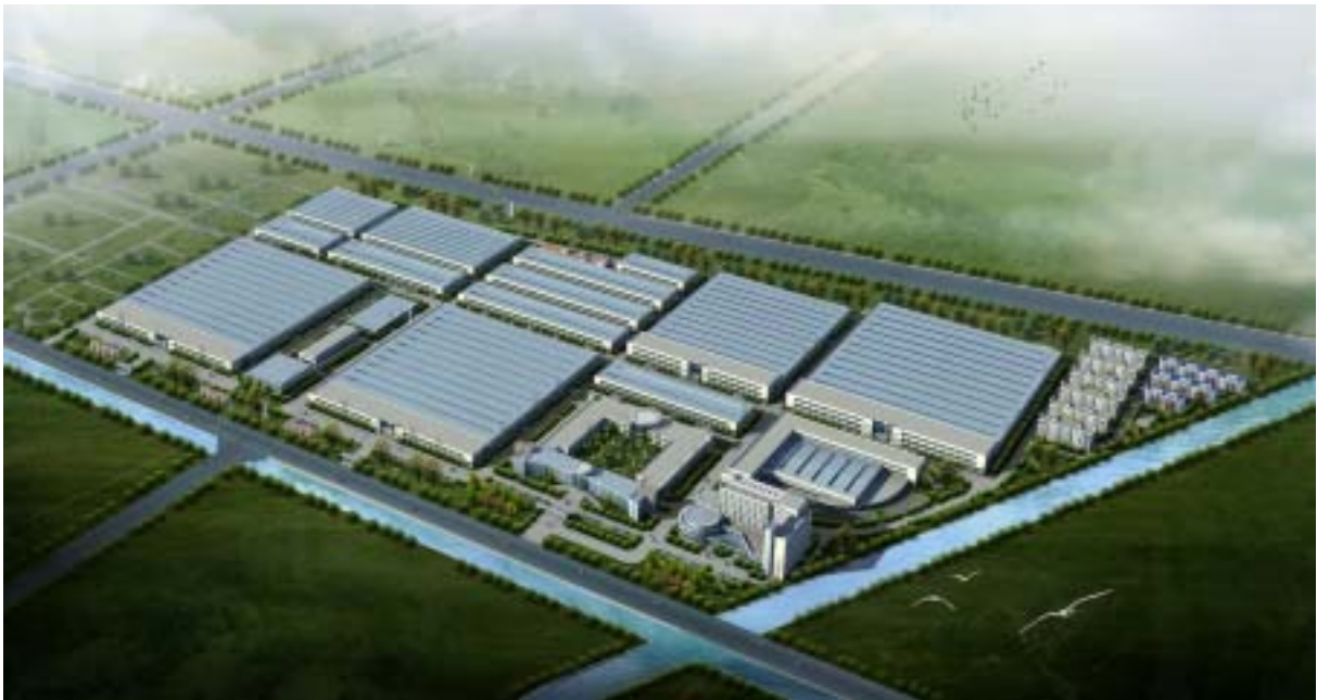
公司新厂区效果图