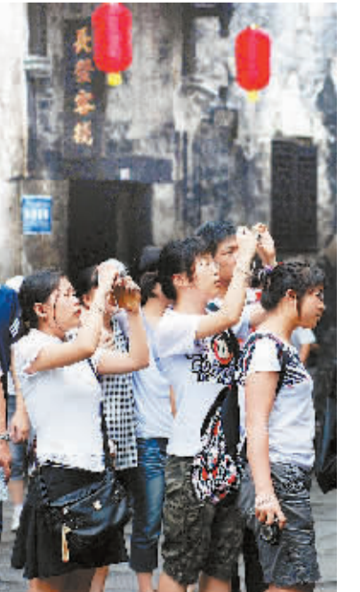
7月5日,来自全国各地的游客在洪江古商城参观。洪江区开展湘商寻祖活动后,这里的游客迅速增加。