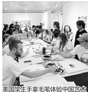
美国学生手拿毛笔体验中国艺术