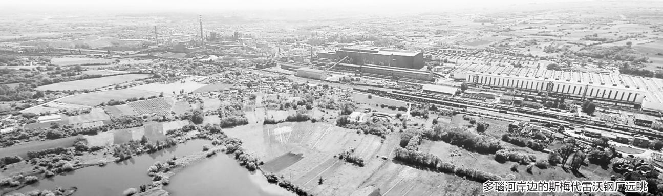
多瑙河岸边的斯梅代雷沃钢厂远眺