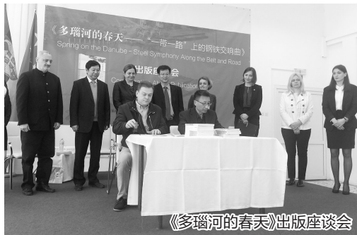
《多瑙河的春天》出版座谈会