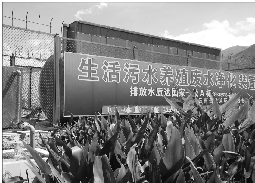
图为大理喜洲镇上关村污水处理项目。