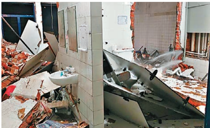
■ 紅磡警署發生熱水爐爆炸意外現場一片混亂。