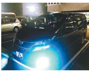
■ 涉案七人車。

警方重申,將會繼續加強執法,打擊酒後和藥後駕駛及其他相關違法行為,以保障市民安全,呼籲駕駛人士切勿以身試法。