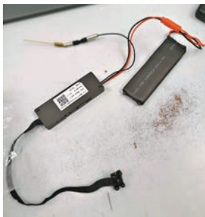
▲ 針孔攝錄機分別安裝在前座司機位及乘客椅背擺放物件的袋口邊。(紅圈示)