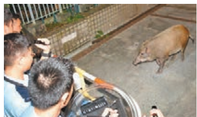
■ 警員持盾牌防大野豬四處亂闖。

警員趕至持盾牌及警棍戒備下,等候通知漁護署及愛護動物協會人員到場展開圍捕,其間大野豬一度衝入職員宿舍花槽內匿藏。事件擾攘約2小時,最後人員以食