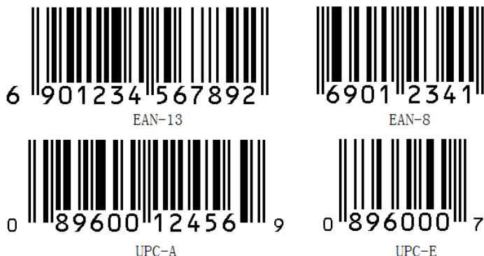
图 2-1 常见的 EAN 条码和 UPC 条码

(2) UPC 条码即通用产品条码, 广泛应用于北美市场, 也称为北美通用商品条码。出口到美国和加拿大的商品, 包装上必须印有 UPC 条码。UPC 条码和 EAN 条码相互兼容, UPC 条码有标准版(UPC-A, 12 位数字组成, 也称为 UPC-12 条码)和缩短版(UPC-E, 8 位数字组成, 也称为 UPC-8 条码)。