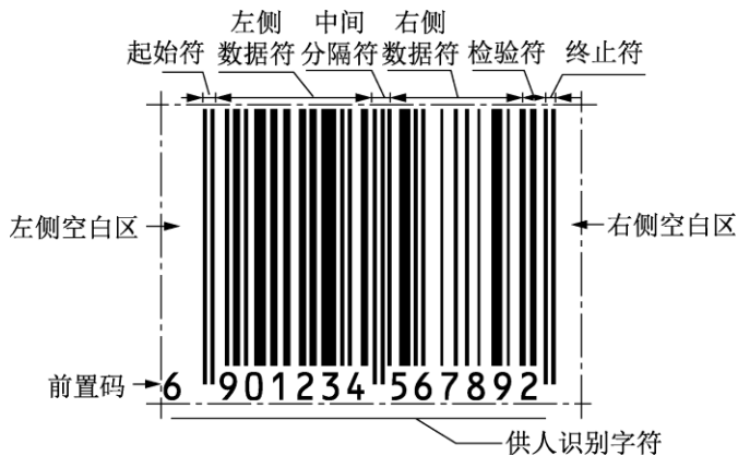
图 2-2 EAN-13 条码符号结构

(5) 右侧数据符。右侧数据符位于中间分隔符的右侧，表示 5 位数字信息，由 35 个模块组成。