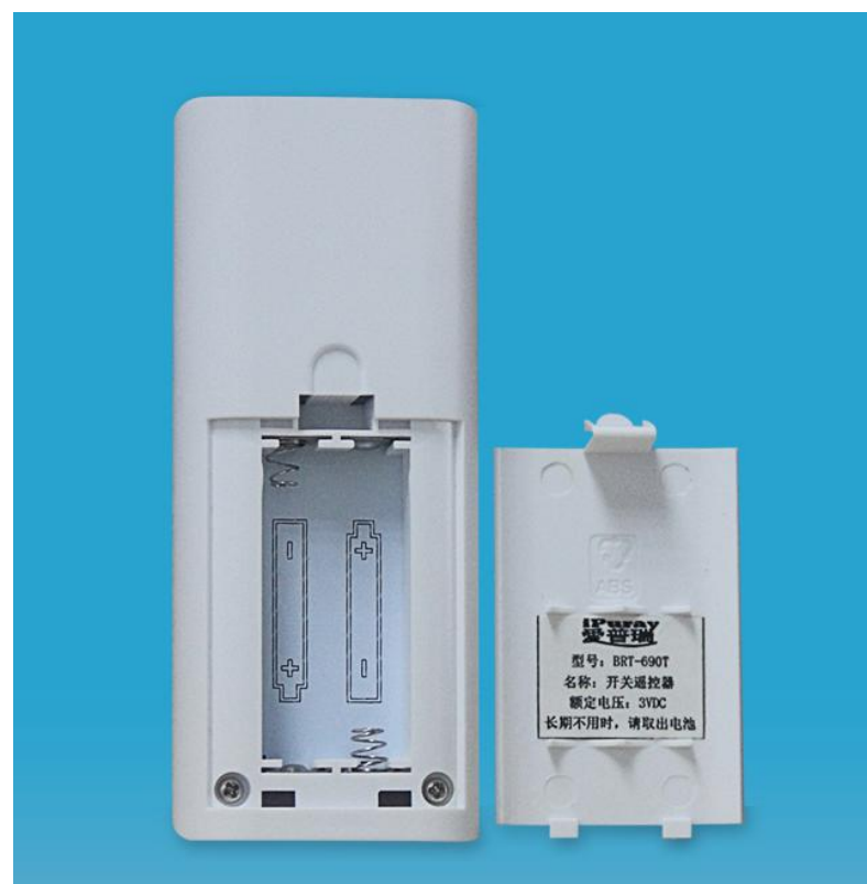
图四 产品背面结构图