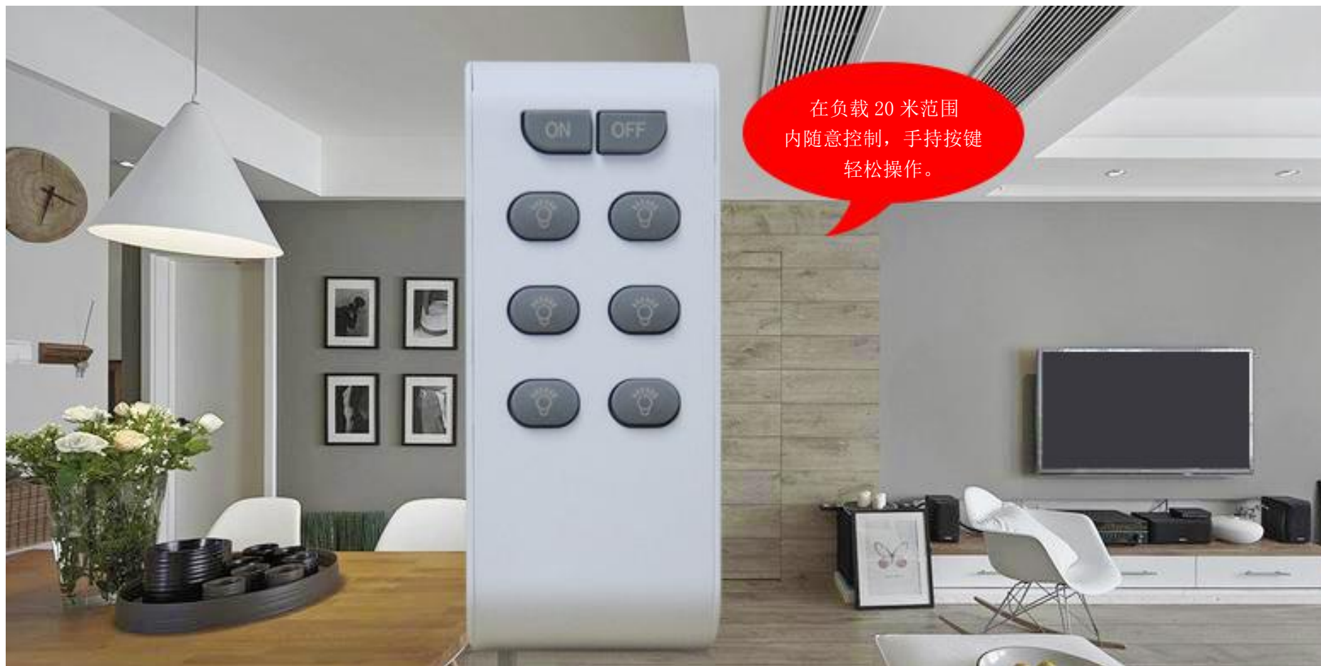
图一 手持式移动开关控制示意图