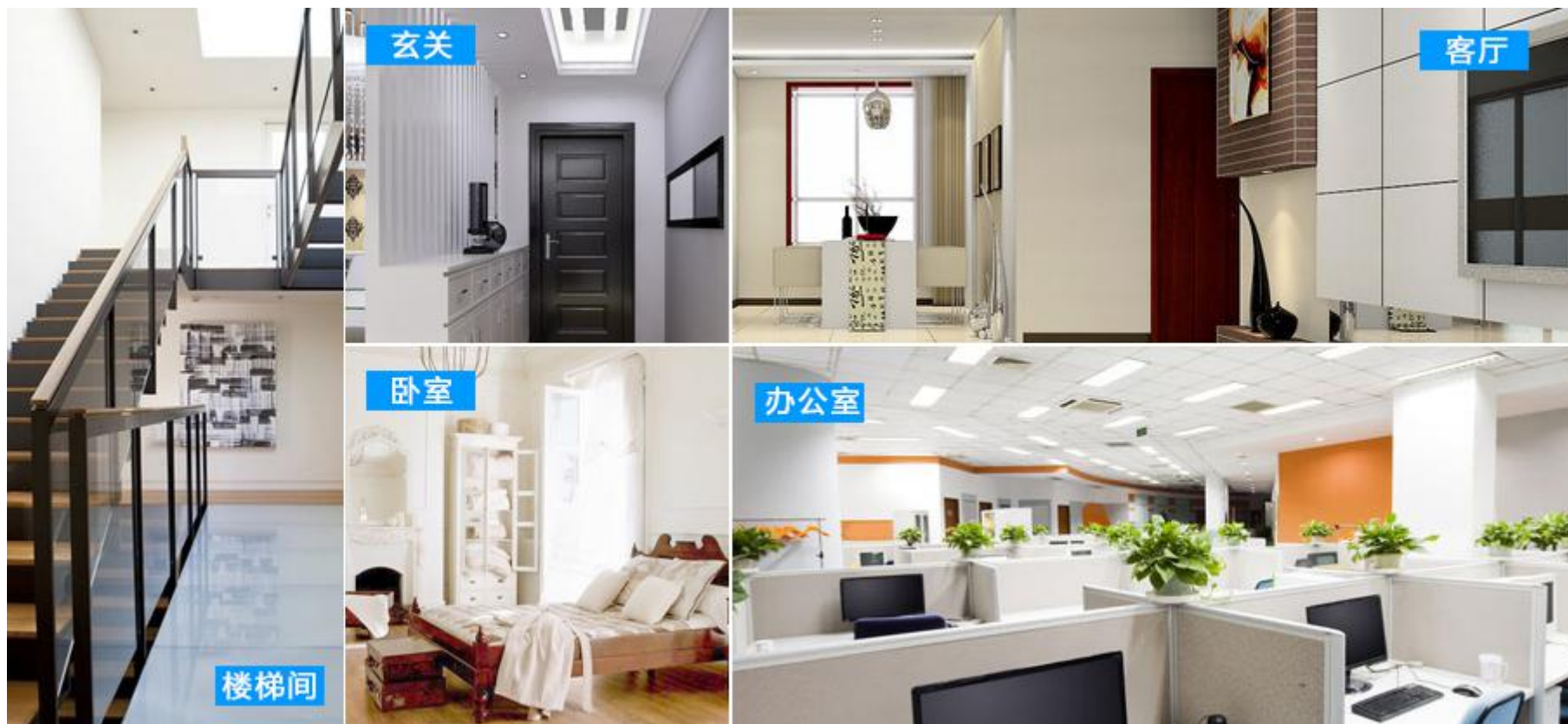
图二 产品适用场景示意图