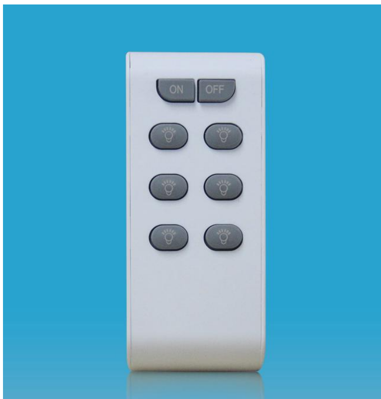
图三 产品正面结构图