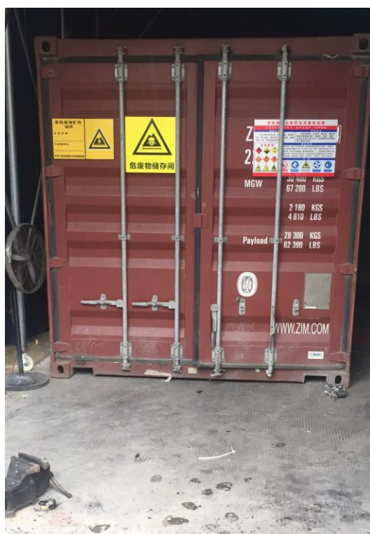
图 4-6 危废仓库照片