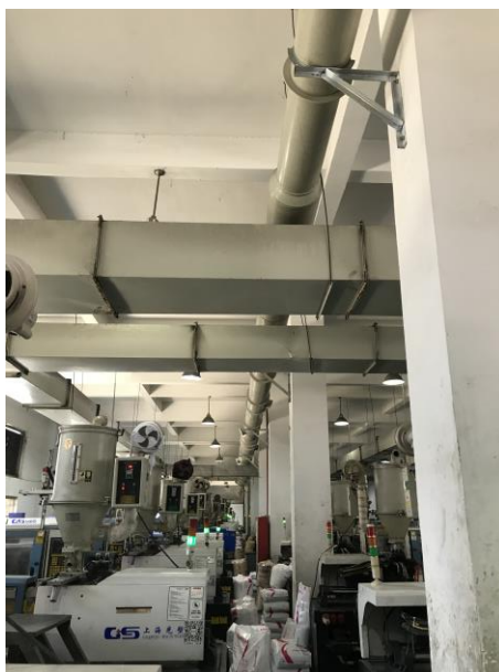
图 4-1 注塑车间集气管道照片