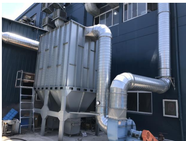
图 4-4 布袋除尘装置照片