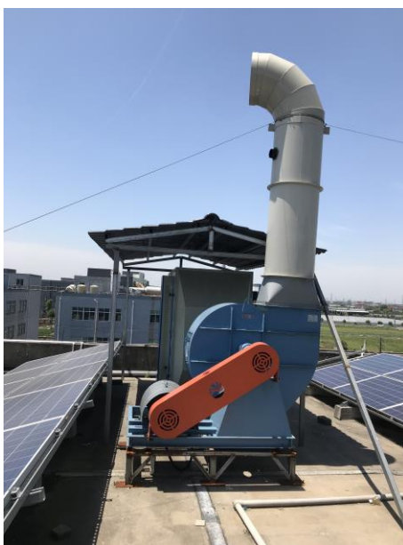
图 4-3 活性炭吸附装置照片