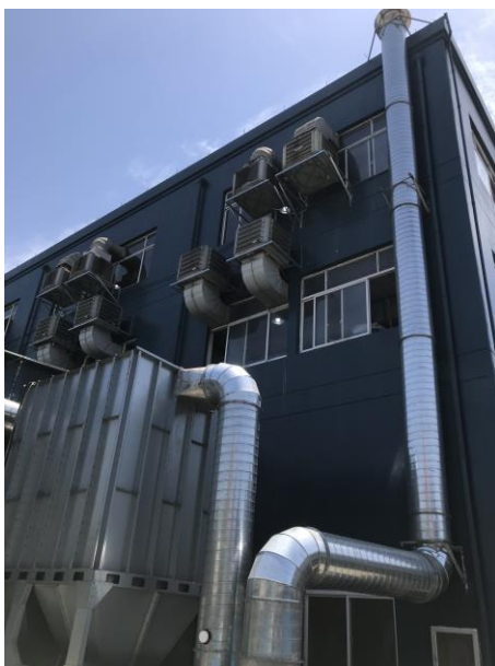
图 4-5 布袋除尘装置排气筒照片