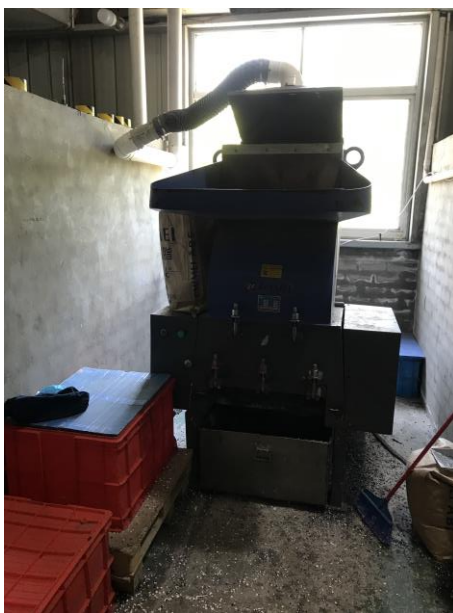
图 4-2 破碎机及专用破碎室照片