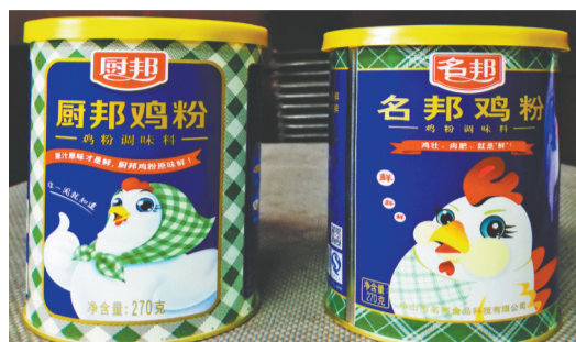
厨邦、名邦包装对比。