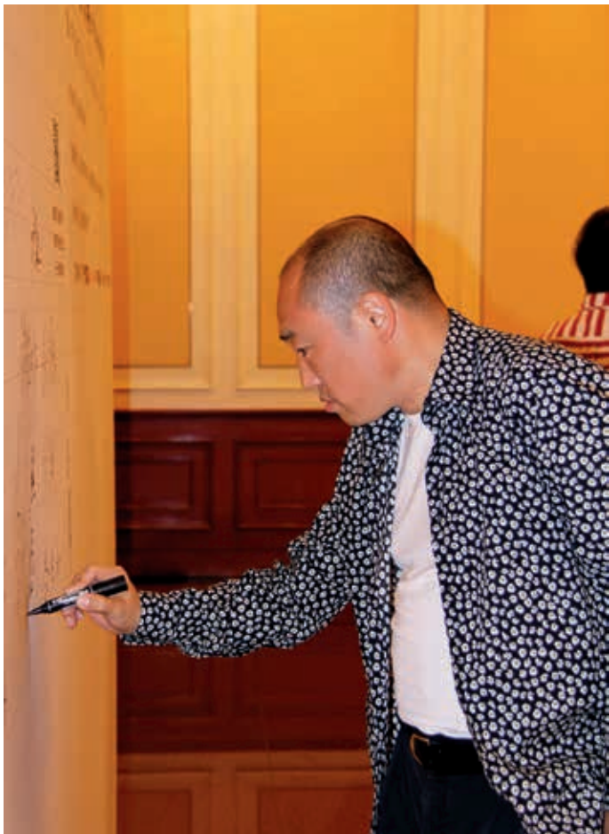
中国国家画院常务副院长卢禹舜

假的问题不仅仅是艺术品行业本身面临的一个突出问题，它也成为社会广泛关注的问题。去年我们委托有关机构对艺术品市场方面的舆情做了一个梳理，其中鉴定真假的问题就是首要的问题。”