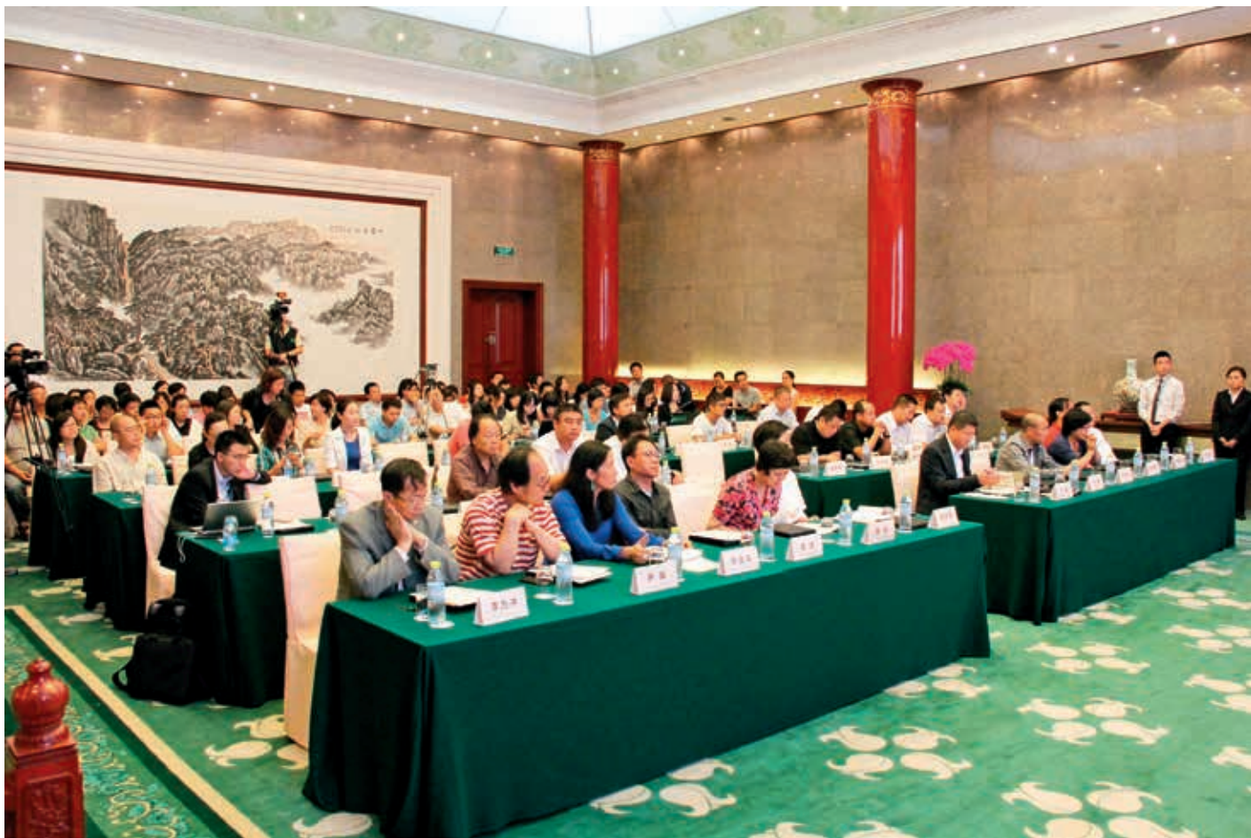
“诚信与传承”中国艺术品市场诚信论坛现场