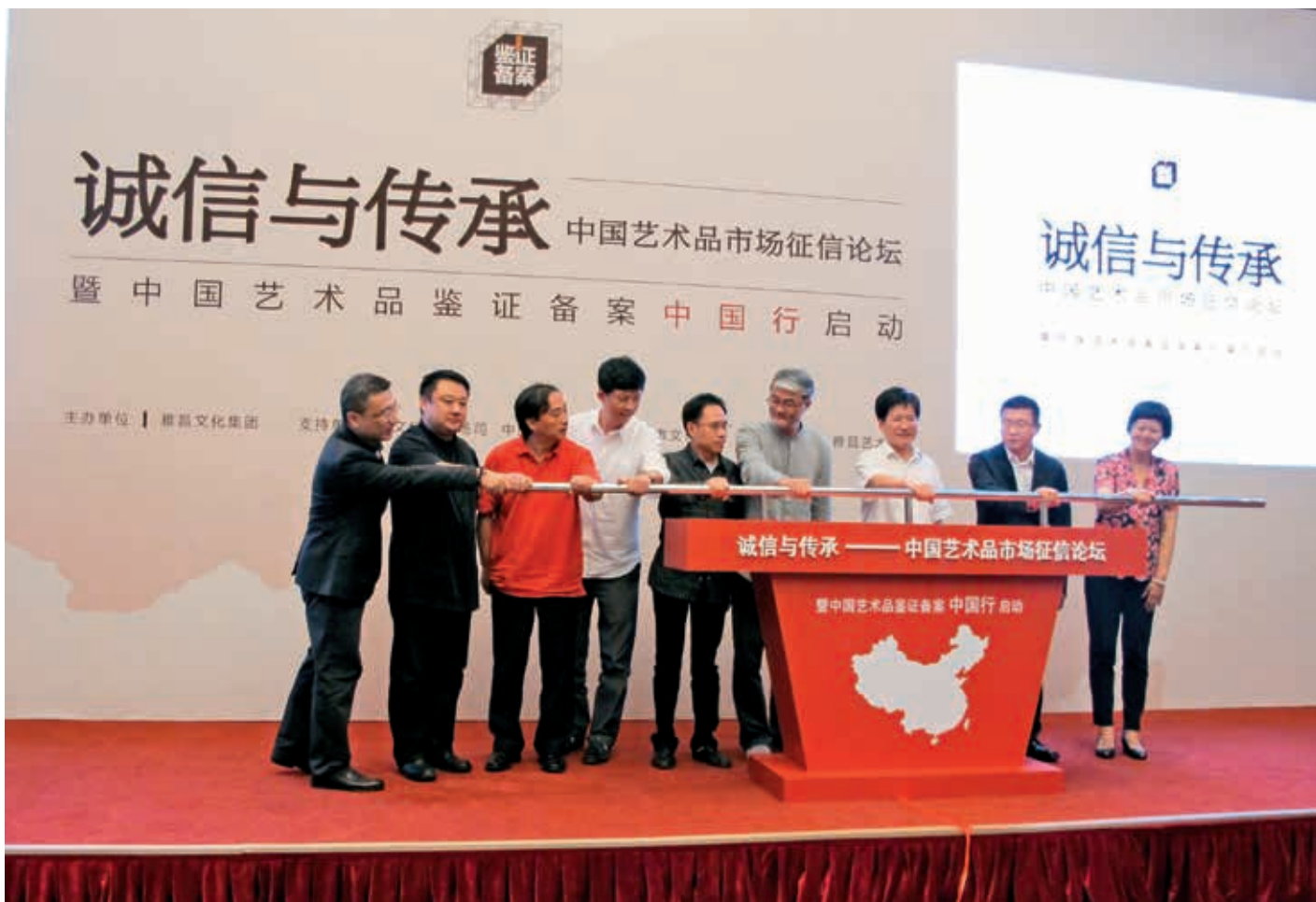
“诚信与传承”中国艺术品市场诚信论坛现场

的问题也是最核心的问题，同时也将大多数努力进入艺术品市场中的人们挡在了市场的门外。艺术品的真伪难辨和不可追溯性造成了诚信缺失和传承的断裂，从而使“鉴定”成为市场中不可承受之重的角色。