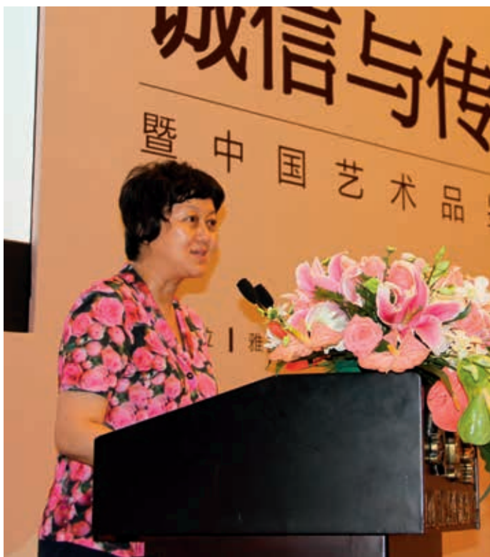
北京市文化局副局长关宇