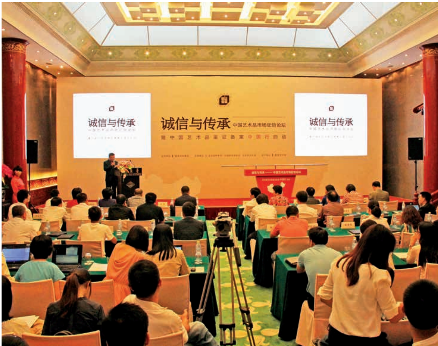
“诚信与传承”中国艺术品市场诚信论坛现场

愿意投资艺术品产业的人望而却步，甚至有些专家也提出了“中国艺术品市场根基不牢固”之说，艺术品市场如果不改变艺术品质量、诚信和可持续发展，那这个市场最终会成为一场泡沫。