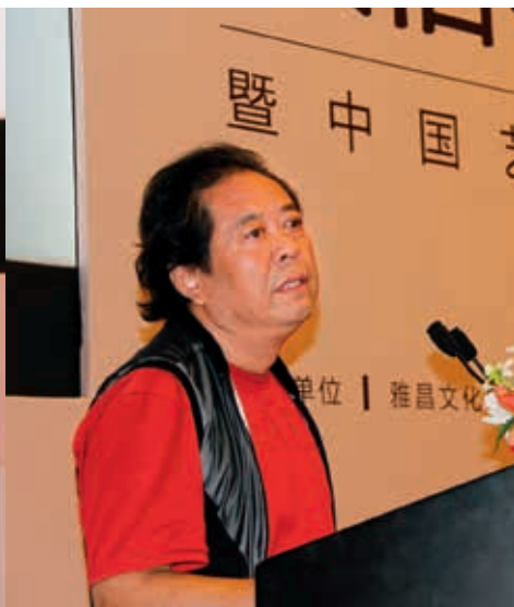
中国美术家协会秘书长刘健