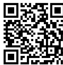
2019 年平安留学 行前培训调查问卷