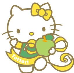
鳥取 Hello Kitty