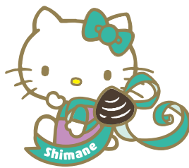
島根 Hello Kitty