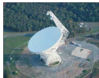
造价7900万美元的绿岸射电望远镜。

在美国华盛顿以东350公里处,有一个名叫“绿岸”的小镇。世界上最灵敏的射电望远镜便设在此处,用于接收来自天体的微弱射电波,因此小镇严禁使用手机等装置,以免其信号干扰望远镜工作。没有手机、无线WiFi、微波炉……这座小镇成了不少美国人心目中返璞归真的“世外桃源”。一些人干脆迁居于此,只为这分宁静。