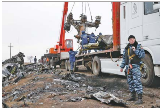
16日,在乌克兰顿涅茨克赫拉博韦村附近,当地工作人员在飞机坠毁地点运送马航MH17航班残骸。 新华/路透