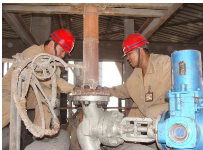
热电厂检修车间通过开展创建“党员示范班组”和专业技术学习、岗位练兵等活动,提高了员工的综合素质,增强了班组的凝聚力。图为10月21日,该车间钳工班党员在精心检修设备,保证设备安全稳定运行。