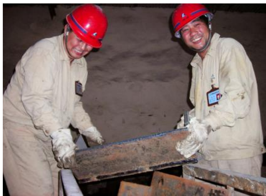
“扬料板原来依靠外加工,现如今我们自己做,一块就能省下近400元。”10月13日,氧化铝一厂四车间钳工班员工高高兴兴地搬卸加工好的扬料板,他们在“挖潜增效,向一个百分点要效益”劳动竞赛中,自己制作扬料板,每年可为企业节约资金10万余元。