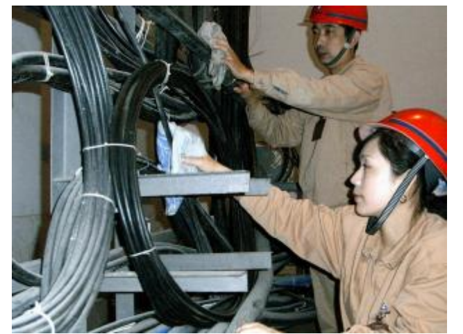
10月21日,水电厂电讯车间党支部组织党员对交换机房主干通信电缆进行了全面清理维护。