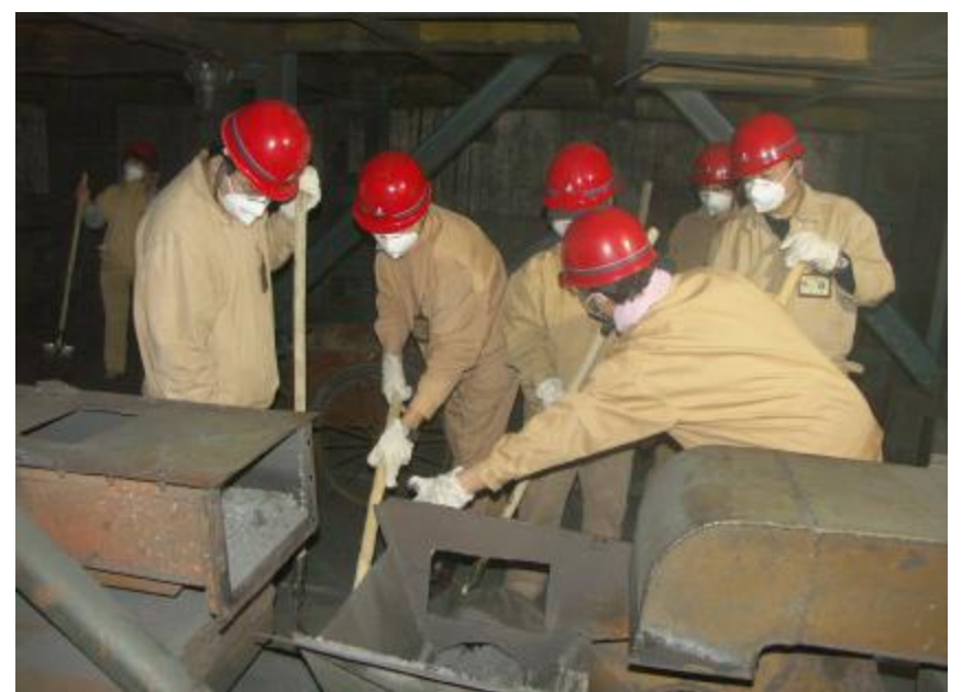
为应对目前的严峻形势和缓解紧张的生产压力,确保完成今年的碳阳极出口合同,10月20日至23日,碳素厂组织机关工作人员分4组下到煅烧车间进行倒料义务劳动。图为义务劳动现场。