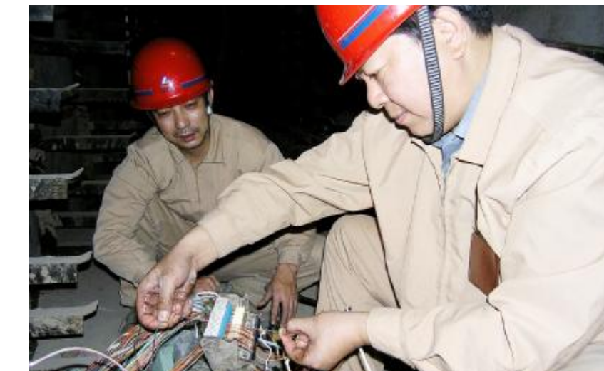
10月9日,水电厂电讯车间对机房至电解交接箱300对被损坏的主干通信电缆进行了修复。图为外线员工在对通信电缆进行接续。