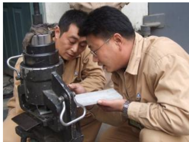
工程公司电装车间工会充分利用生产间隙,组织开展各种形式的技术比武活动。图为10月16日,电装车间员工正在开展电气设备故障排除技术比武。

关工作作风,深入生产一线调查研究,围绕各单位降本增效重点工作,帮助基层协调解决生产经营过程中的有关问题,严格按照《机关服务队工作人员服务目标及守则》要求,做好耐心细致的思想政治工作,将形势讲清、任务讲透、目标讲明、措施讲实,将各级管理者和广大员工的思想和行动统一到全面落实分公司形势任务动员大会精神上来,坚定信心,克难攻坚,为确保分公司大局的安全稳定,实现总部下达的各项生产经营目标作出积极的贡献。