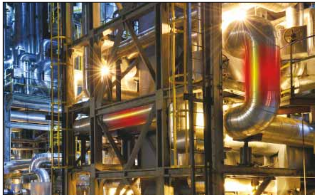
反应塔生产效率监测