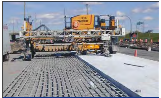
高速公路安全监测