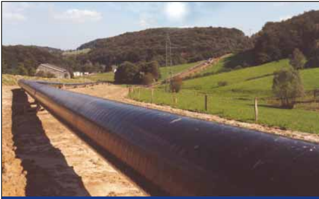
油气管线泄漏监测