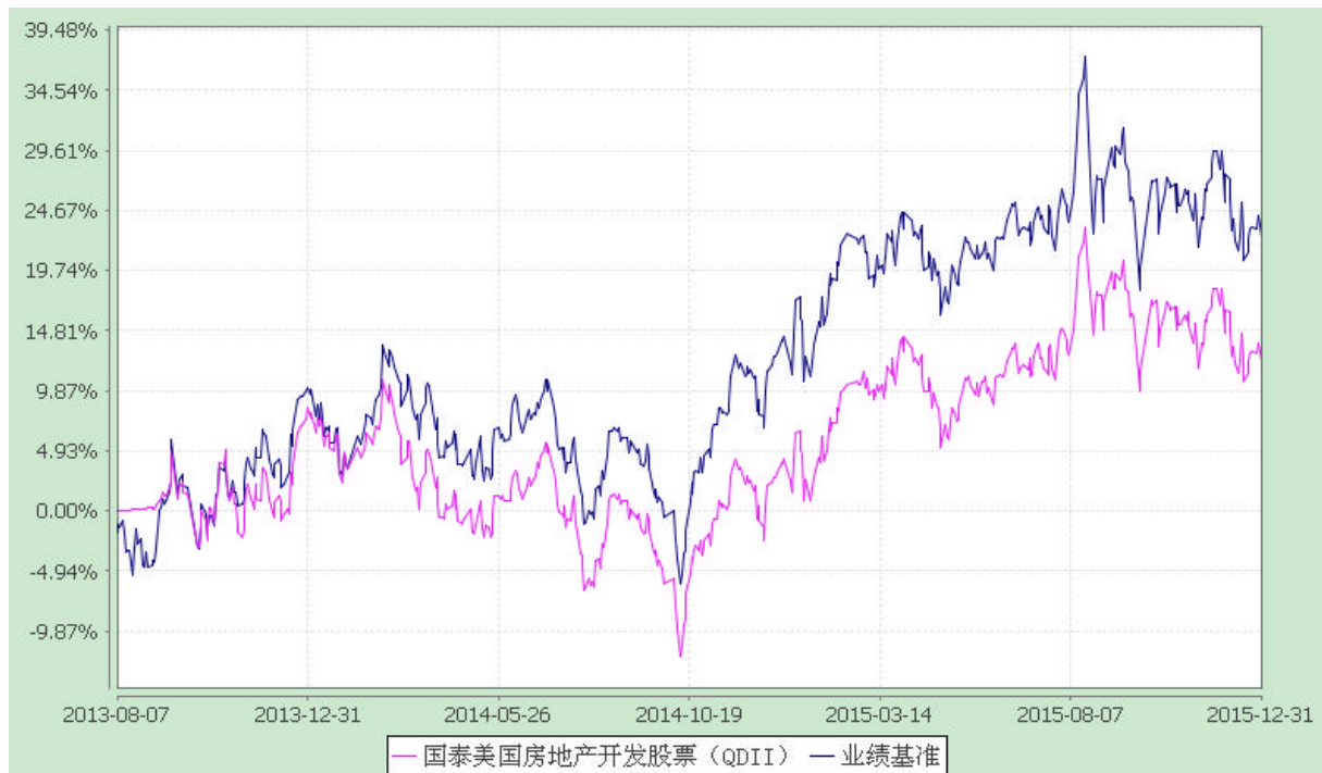
国泰美国房地产开发股票型证券投资基金 份额累计净值增长率与业绩比较基准收益率历史走势对比图 (2013 年 8 月 7 日至 2015 年 12 月 31 日)

注：(1) 本基金的合同生效日为 2013 年 8 月 7 日，本基金在六个月建仓期结束时，各项资产配置比例符合合同约定；