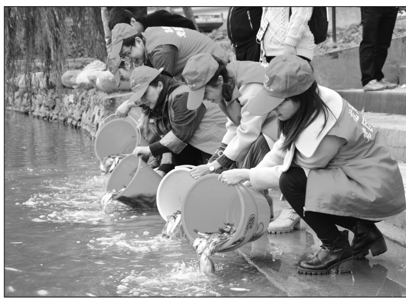
浙江省玉环市利用冬季鱼苗放养成活率最高的有利时机,近日在全市各主要河流、湖港开展增殖放流活动。放养鱼苗可有效滤食河水中的浮游植物和动物,防止河水出现富营养化现象,改善水质和水域的生态环境。

同时,严肃追责问责,衡水市委市政府对5个县市区党政“一把手”进行了约谈,衡水市政府对8个乡镇党政“一把手”进行了约谈。衡水市纪检监察部门对8个相关县市区及22个单位启动问责程序。