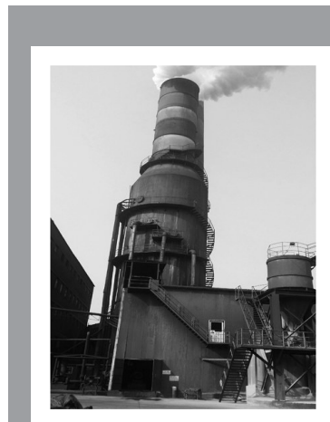
左图为烧结脱硫石灰-石膏湿法环保设施,其设计处理能力为960000m 3 /h;设计处理效率为95%;实际处理能力为960000m 3 /h;实际处理效率为95%;与主体设施的同步率为100%。

佰工钢铁在生产过程采用节能减排技术,先后通过了GB/T24001-2004-ISO14001:2004环境管理体系认证、GB/T19001-2008-ISO9001:2008质量管理体系认证、GB/T28001-2011职业健康安全管理体系认证以及能源管理体系认证和测量管理体系认证,并取得相应体系认证证书。