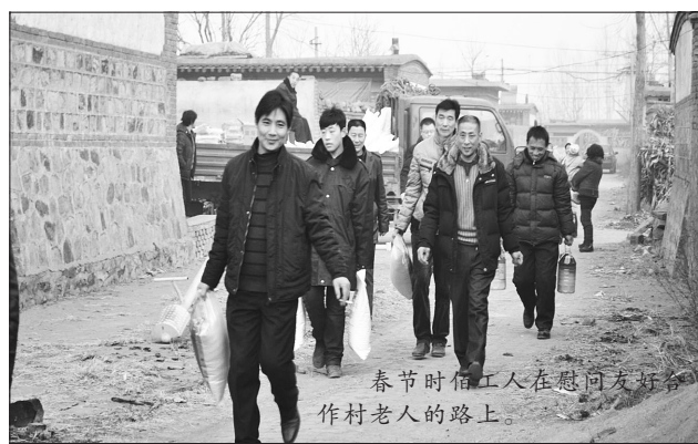
春节时佰工工人在慰问友好村作村老人的路上。

“发展县域经济、造福一方百姓”是佰工钢铁的社会责任。多年来,公司在致力于发展创新的同时,积极投入公益慈善事业:在汶川、玉树地震及卢龙县水灾中积极捐助善款,为秦皇岛市卢龙县的市政管理及公益事业捐助善款,为秦皇岛市慈善协会捐助善款,累计500余万元;为公司附近村民子女考取大学的家庭捐助助学金,累计200余万元;为公司附近村民缴纳农村合作医疗保险、每年春节慰问70岁以上老人,累计100余万元。