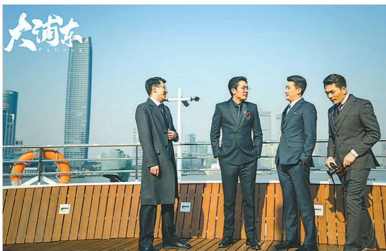
上海出品的电视剧《大浦东》昨起在中央电视台一套黄金档播出,献礼改革开放40周年。

然而,镜头要拍下今日浦东的繁华并不难,要重现昨日浦东的味道,成了摆在剧组面前的难题。《大浦东》要体现陆家嘴、浦东洋泾老街的风云变幻,还要复刻那些早已消弭的老痕迹,是挑战也是责任。”王义明说,现在的浦东早就没了洋泾街,为此,剧组在松江盛强影视基地搭建了一条街,参照上世纪八九十年代的洋泾老街,以1:1实景搭建。“老街上有当时浦东人熟悉的公用电话亭、老虎灶、弄堂、剃头店、廉价出租房等,还有‘老娘舅’‘四眼’等带着市井气的邻里