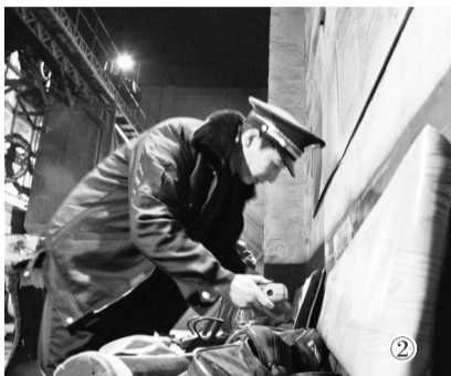
①检查餐厅油烟净化设施是否合格。②检查燃煤电厂脱硫情况。③监测扬尘控制情况。