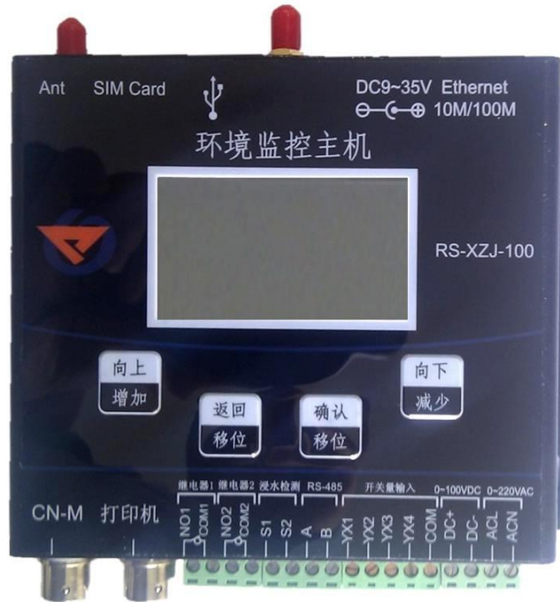
RS-XZJ-100-W 环境监控无线主机

无线接收主机分两种：RS-XZJ-100-W 环境监控无线主机；RS-JSQ-W 简易无线接收主机。