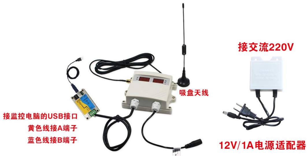
RS-JSQ-W 简易无线接收主机

一台 RS-XZJ-100-W 环境监控无线主机无线主机最多可管理 32 台 RS-GZ-DY-2 无线测点；一台 RS-JSQ-W 简易无线接收主机最多可管理 200 台 RS-GZ-DY-2 无线测点，关于无线主机的使用请参照无线主机的使用说明。