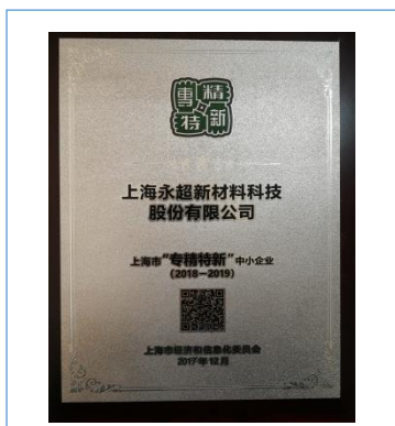
获得 2018-2019 年度上海市“专精特新”中小企业