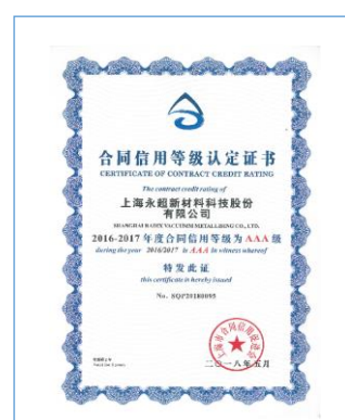
获得 2016-2017 年度合同信用等级为 AAA 级