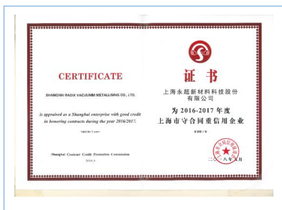
获得 2016-2017 年度上海市守合同重信用企业