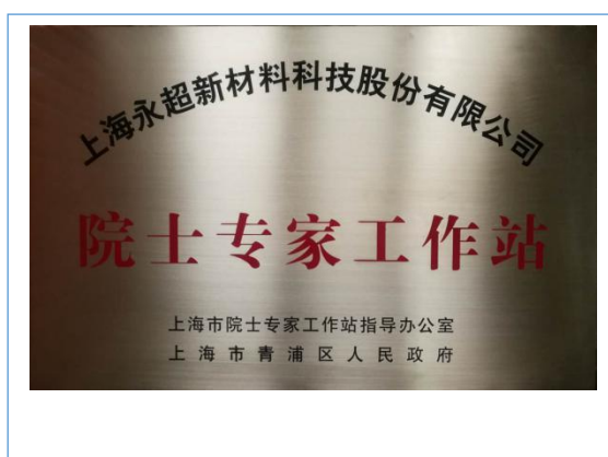
获得上海市“院士专家工作站”称号