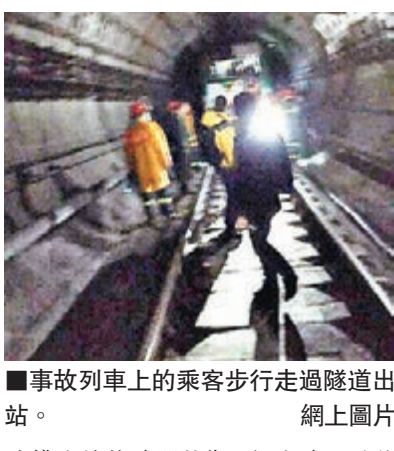
事故列車上的乘客步行走過隧道出站。

上海地鐵管理方16時許在官方微博上發文,澄清本次故障並非網傳的着火或碰撞。但由於維修難度大,故