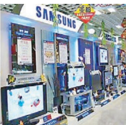
三星某型號電視機存在安全缺陷。

香港文匯報訊(記者 敖敏輝 廣州報道) 廣東省工商局10日發佈2014至2015年度第一批缺陷商品名單。根據檢測,這些商品不符合強制性標準且有危及人身、財產安全危險,其中包括家庭紡織用品、服裝、電視機、電熱水器、童車、玩具、鞋類、燃氣灶、燃氣熱水器、制動液共112款商品。這批缺陷商品中不乏知名品牌,其中,某型號的韓國品牌三星電視機電氣絕緣存在問題,有可能引發火災或電擊危險。