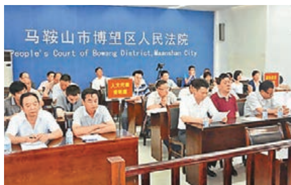
內地多地法院庭審旁聽開放度加大。

香港文匯報訊 據中通社報道,最高人民法院10日首次對外公開發布《中國法院的司法公開》白皮書(以下簡稱白皮書)。其中提到薄熙來案的全程微博直播,稱