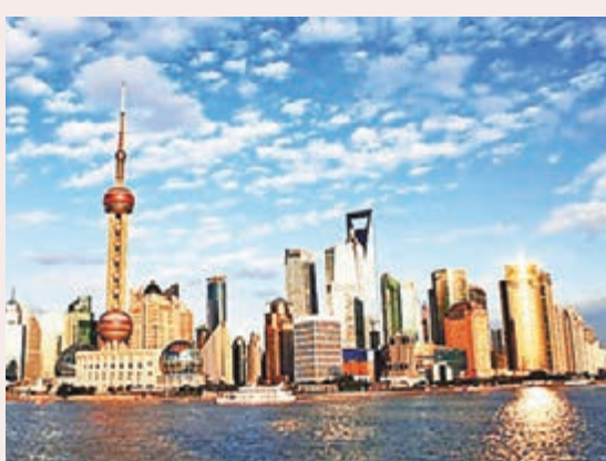
上海連續三年位列榜首。資料圖片

此外,本次評選第一次調查了外籍人士對中國縣級市的知曉情況,數據顯示,江蘇江陰市、江蘇昆山市、浙江義烏市、浙江紹興縣、江蘇常熟市為中國百強縣中外籍人才知曉度最高的5個縣市。