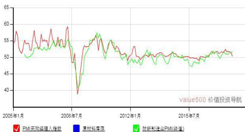
中国 PMI 走势图