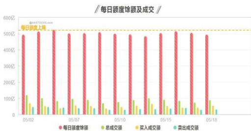
每日沪港通额度变化图

有媒体援引消息人士说法称，美国将取消中兴通讯销售禁令，根据讨论的协议维持其业务。上述消息人士还称，中兴通讯将被要求大规模调整管理层和董事会。对此，记者联系了中兴方面进行核实，中兴回应：消息属实。