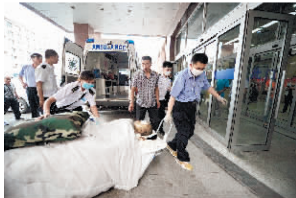
6月3日,一位重度烧伤患者被120急救车从长春市烧伤医院转至吉林大学第一医院二部接受治疗。

据其介绍,火灾发生后,工人们纷纷往外逃生,期间出现了踩踏事件。逃到外面后,他闻到了强烈的异味,随即被送到医院救治。