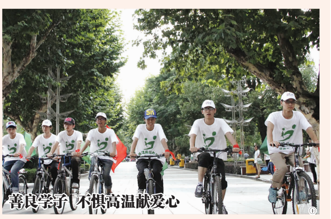
善良学子不惧高温献爱心 浙师大社联曙愿队,一群善良学子组成的队伍。在这个流火的七月,他们放弃享受家中凉爽的空调风,走上街头,举行义卖、募捐、骑行,用自己微薄的力量,给老人献爱心,向市民倡导绿色生活……

图① 挂着汗珠的年轻脸庞,飞扬的青春气息。近日,一支身穿白T恤的自行车骑行队伍吸引了不少金华市市民的眼球,他们就是曙愿队的队员。当天,该实践队在市区举行“单车游金华”活动,藉此弘扬低碳环保的生活理念。