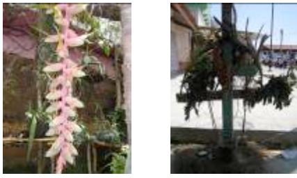
图10观赏风梨花及其使用（装饰十字架）

一些稀有植物比如兰花被广泛运用于墨西哥教堂作为装饰。这种象征性意义使得在制定森林生态保护决策时宗教和原住民社团的参与有相当重要的作用。因为这能够激励这些团体将这些物种划分出来成立特殊保护区。