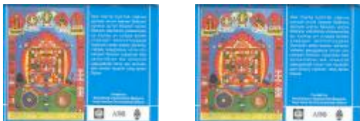
图3佛教环保年历画

大家可从下面的一些图片对前八个子项目有个大概了解。比如图3通过佛教的年历画宣传佛经对环境的关怀。图4则通过佛经故事说明人类如果破坏自然，自己会遭到痛苦的报应，宣传环保对人的实际影响。图5的墙报呼吁狩猎稀有动物是违反佛教的教义。