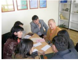
图6向我们展示墙报栏的设计。大家可以看出，这种墙报栏简易方便。可以安置于寺庙内或入口处。向游客展示一些环保方面的图片和宣传资料。图7则记录了不同的工作间，论坛，培训班。显然，这些工作间，论坛，培训班大都是互动的佛教徒介入的讨论性质，而不是刻板的讲座和会议。