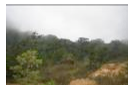
图8南墨西哥切帕斯州森林

经过两年的考察和评估，切帕斯州神圣兰花项目将于2007年九月启动，整个项目将为期三年。合作方有ARC，墨西哥切帕斯州普罗内图拉保护自然机构、世界银行、墨西哥环境部、墨西哥林业部、切帕斯州立环境和林业管理部门、当地偏远地区的村民，当地的宗教社团等。