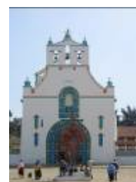
图9 三鹏卡木拉小镇 居住着当地原住民社团之一

这里我解释一下非木材物种产品的意思，就是那些用森林里不是木材的物种而制作出的产品，比如我下面将要提到的棕榈制品。