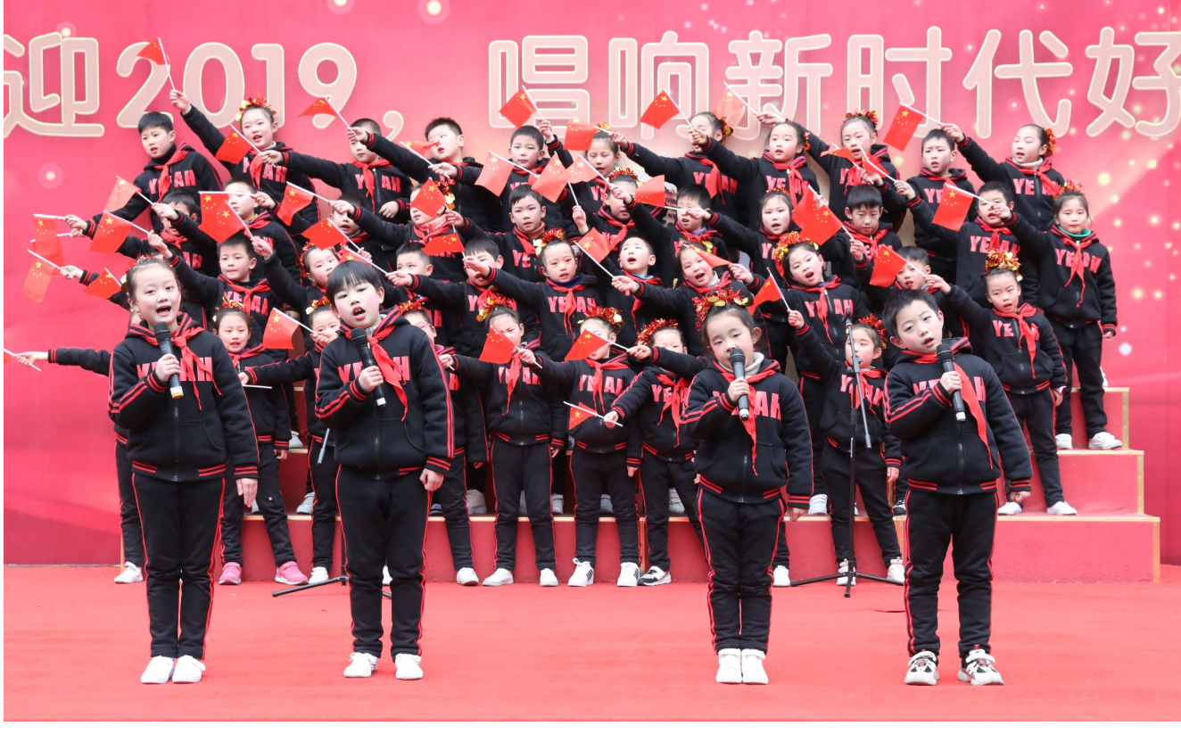
唱响新时代 争做好少年

务分解到各基层工会,实行责任目标管理和领导干部包联责任制,做到分工明确。市总工会还强化培训,努力为出险职工提供高效快捷的服务。 去年全市共有947个基层工会组织4.71万人参加了互助保障计划,收缴保费401.8万元,办理赔付858人次,赔付款达312.4万元,有效提高了职工抵御风险的能力。此外,市总工会还为98名困难职工会员发放爱心救助款14.7万元。 ·查春玲 吴国华·