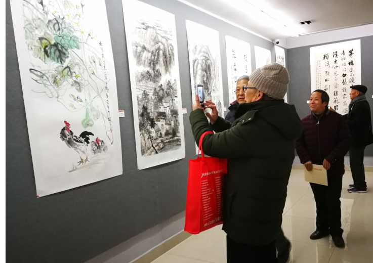
丹青绘盛世,翰墨迎新年。1月1日,由市政协书画院举办的贺新年书画作品展在市美术馆开展,共展出108幅书画作品。这些作品集中展现了一年书画师们深入实践、深入生活的艺术创作成果。

防检查站专门做出部署,根据口岸客流预测情况,开足检查通道,加强现场组织引导,充分发挥自助通关系统作用,提高口岸通行能力和效率,并安排警力为需要特殊照顾的老人、儿童以及其他行动不便旅客提供帮助。 边检站负责人表示,无论体制机制如何变化,边检站履行服务出入境旅客、维护口岸安全稳定、促进地方经济建设的职责使命不变,将为广大中外旅客提供更加专业、高效、友好的通关服务。 ·江鼎 周沐雨·