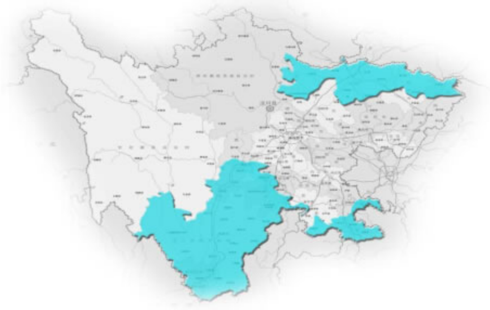
图 4 四川省秸秆综合利用盆周山地生态发展区布局图

川西高原特色发展区。包括凉山州、甘孜州、阿坝州等3个市（州）的26个县（区）。该区域海拔高、种植业生产水平低，是我省重要的畜牧业和特色产业发展区，秸秆以玉米、小麦、薯类为主。依托区域特色畜牧业，在秸秆还田基础上重点发展秸秆青贮、氨化饲料化利用方式，解决高原冬季牲畜（牦牛、羊等）圈养饲料供给，走高原特色秸秆综合利用之路。