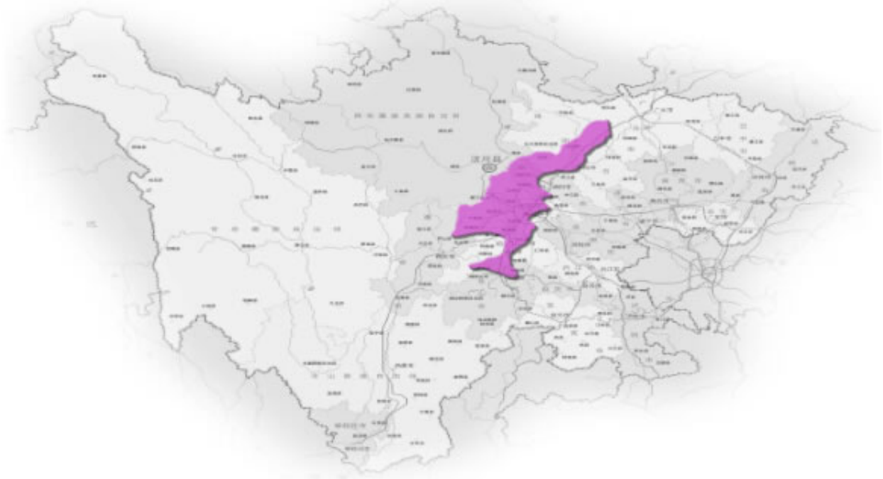
图 2 四川省秸秆综合利用成都平原高效发展区布局图

区域内经济发达，技术先进、交通便宜，秸秆综合利用水平较高，以提高秸秆综合利用效率、产品附加值、科技水平和完善产业链为核心，重点发展秸秆机械化粉碎还田、秸秆商品有机肥、秸秆制板等工业化利用、秸秆食用菌基料、秸秆育苗栽培基质、秸秆固体成型燃料、秸秆颗粒饲料、秸秆发电等秸秆综合高效利用方式，建设完善秸秆综合利用收储运体系，依托区域高校、科研院所及制造企业，积极开展秸秆综合利用关键技术及配套设备研发制造，辐射带动其他区域秸秆综合利用发展。