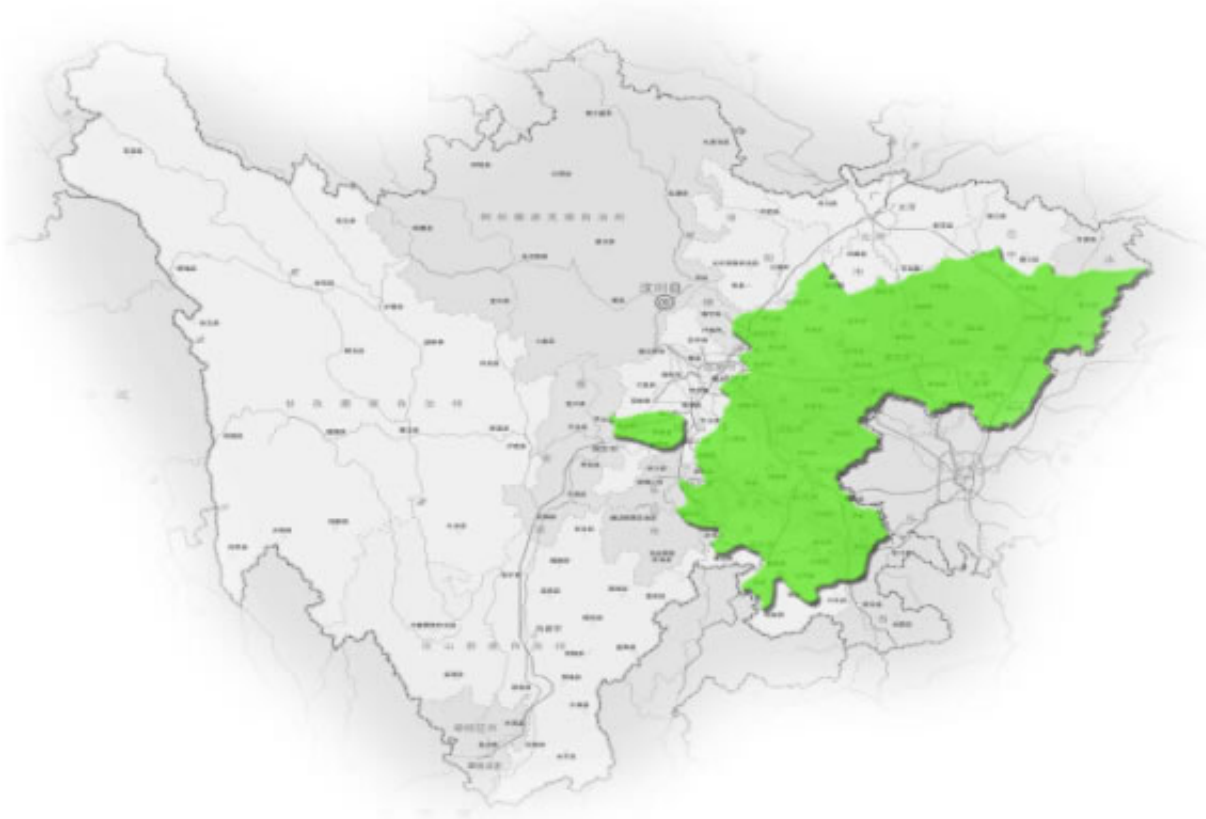
图3 四川省秸秆综合利用盆周丘区循环发展区布局图

盆周山地生态发展区。包括泸州、广元、宜宾等9个市的38个县（市、区）。该区域分布在四川盆地边缘地区，地形以深丘为主，农业生产条件较差，秸秆以水稻、玉米、油菜、薯类为主。依托本区域良好的生态本底，以秸秆综合利用服务生态农业发展为指导，重点发展秸秆覆盖、腐熟还田、秸秆青贮、氨化等饲料化利用、秸秆沼气及秸秆食用菌栽培等秸秆利用方式。