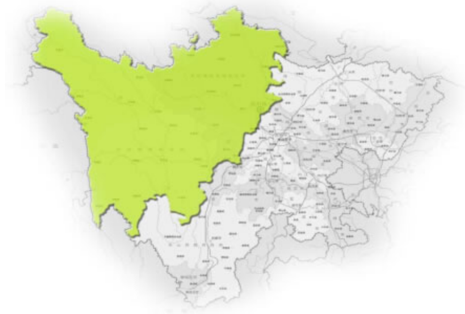
图 5 四川省秸秆综合利用川西高原特色发展区布局图

川西高原特色发展区。包括凉山州、甘孜州、阿坝州等3个市（州）的26个县（区）。该区域海拔高、种植业生产水平低，是我省重要的畜牧业和特色产业发展区，秸秆以玉米、小麦、薯类为主。依托区域特色畜牧业，在秸秆还田基础上重点发展秸秆青贮、氨化饲料化利用方式，解决高原冬季牲畜（牦牛、羊等）圈养饲料供给，走高原特色秸秆综合利用之路。