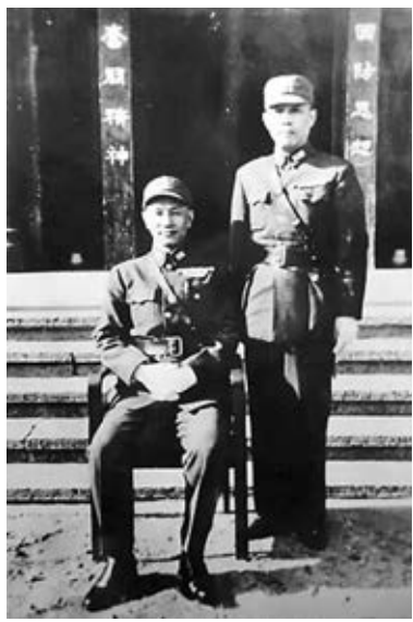
蔣介石和錢大鈞。

手諭內容既有對時局的判斷，也有對下屬的牢騷，如「錢主任：以後來電，每電均須先簽擬意見，再呈，不得以原電搪塞，叫我自擬辦法。」而其中涉及的人物包括宋美齡、李宗仁、薛岳、陳誠、顧祝同、宋子文、馬相伯、虞洽卿、杜月笙等。據此前媒體報道，這份蔣介石在抗戰期間寫給錢大鈞的手諭，事涉兩廣事變、西安事變、七七事變、武漢會戰、成立飛虎隊等眾多改變歷史進程的重大事件，公眾也可以從字裡行間，看到蔣介石事無巨細的性格特點。