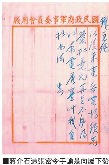
蔣介石這張密令手諭是向下屬發牢騷。