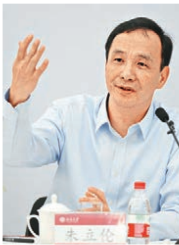
朱立倫要蔡英文回答，國民黨哪一點不在「憲政」體制下？

「立法院」副院長洪秀柱說，從兩岸關係維持現狀，到在「憲政」體制的架構之下談兩岸，蔡英文要說清楚她所認知的「憲政」體制是什麼。