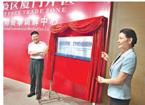
最高人民法院副院長賀榮(右)和廈門市委書記王蒙徽共同為廈門國際商事仲裁院和廈門國際商事調解中心揭牌。

香港文匯報訊(記者 翁舒昕 廈門報道) 福建自由貿易試驗區廈門片區昨日舉行廈門國際商事仲裁院、廈門國際商事調解中心揭牌儀式。據稱，該仲裁院及調解中心的專業指導委員會的成員組成，將包括較大比例的台灣籍人士，以利涉台商事糾紛解決。