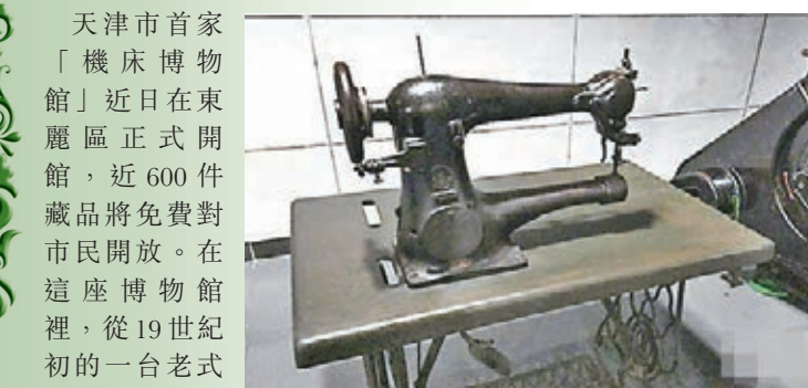
勝家縫紉機距今已有近200年歷史。

天津市首家「機床博物館」近日在東麗區正式開館，近600件藏品將免費對市民開放。在這座博物館裡，從19世紀初的一台老式縫紉機到生產過「東方紅火車」車輪機床，這些鋼鐵機械帶着歲月的痕跡，如今安靜地陳放在博物館中，任時光匆匆而過歷久彌新。