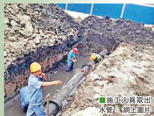
施工人員取出水管。

運行了106個春夏秋冬，深埋湖北漢口中山大道六渡橋地底的武漢最老水管日前部分出土。5日下午，這段約200米長百年供水管已取出一根約3.7米的完整水管。