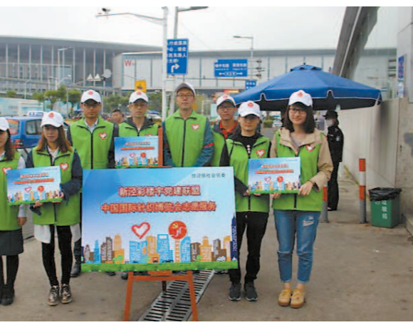
徐泾镇“新泾彩”楼宇党建联盟志愿者在行动。

“一委”，指镇社会党委，担当起楼宇党建的业务指导和运转枢纽。“六部”，指已经成立独立党支部或联合党支部的六个支部，分别是麦迪普机械港党支部、德真工贸党支部、一通世界党总支、梦谷创意园联合党支部、微格产业园联合党支部、金梦坊创意园联合党支部。“六站”指在已成立支部的楼宇企业中建立党建服务站，并以“就近连片”的方式辐射带动周边未成立党组织的楼宇企业。