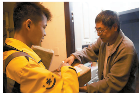
韵达公司党委开展党组织服务活动。

通过邀请社会组织参与、成立志愿者队伍、参与河道巡访等措施，进一步深化楼宇企业党员的责任意识和担当意识，鼓励楼宇企业投身社会治理，参与地区发展。19栋楼宇企业与练塘镇经济薄弱村开展结对，为练塘镇筹集300万共建发展资金，投入到道路修整、河道治理、公共设施安装等多个扶贫援建项目，有效促进了青浦东西两翼的同频共振。