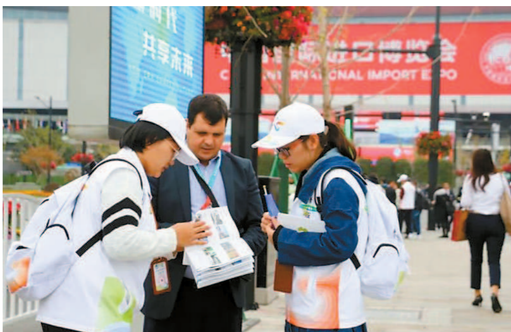
青浦区志愿者在进博会现场为外国友人提供咨询服务。

同时掀起了建功立业的热潮。结合全区进博会服务保障工作的推进，开展“争当跨越先锋”立功竞赛、我为企业发展献一计“金点子”征集活动。绿洲江南园党支部党员主动为支部建设、企业发展建言献策，提出购买三个