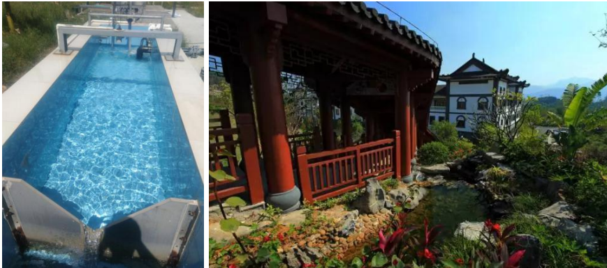
惠州项目废水处理设施及园区绿化

本集团一般聘用第三方处理废水，以保证我们排放到市政污水管道的污水达到相关排放标准。垃圾渗滤液排放限值严格按照下属公司与当地政府部门签署的特许权协议的相关执行标准执行，若无特别约定，接管废水按国家《污水综合排放标准》（GB8978-1996）标准执行三级排放，接管至污水处理厂做进一步生化处理。直排企业按照受纳河体执行一级或二级排放标准。