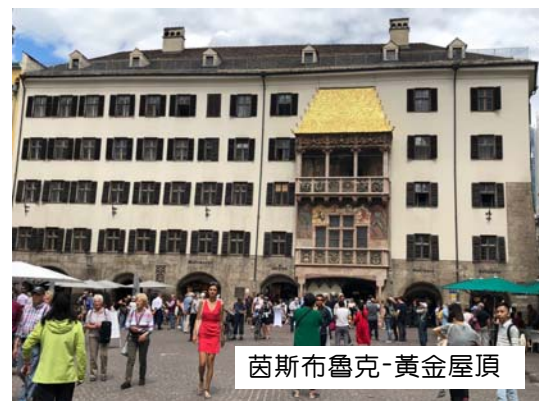
茵斯布魯克-黃金屋頂