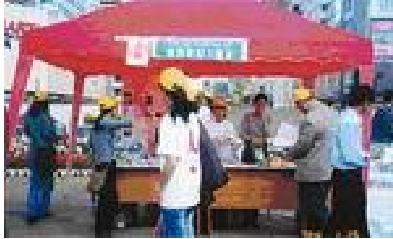
图为英国救助儿童会的宣传台

表达了他对受艾滋病毒感染和威胁的人们的关爱与支持。一名志愿者走上台去，将一件由百名志愿者签名的 T 恤赠送给濮存昕，濮存昕当场脱去外衣，高兴地穿上了 T 恤，并与部分志愿者合影，场上气氛达到高潮。11:30，濮存昕离开会场，志愿者高举红丝带，在场所有人合唱《爱的奉献》，活动接近尾声。