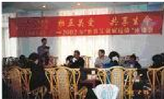
▲2002 瑞丽市全民同抗艾滋病座谈会会场

2002 年 11 月 28 日，在瑞丽市委、市政府的支持下，英国救助儿童会与瑞丽市艾滋病综合防治项目办公室召开了 2002 年全民同抗艾滋病座谈会。参加此次会议的有瑞丽市政府副市长、英国救助儿童会项目官员、瑞丽市卫生局局长、部分管理委员会委员单位和瑞丽市防疫站领导、红丝带大使及青年志愿者，妇女儿童发展中心部分成员。座谈会以“相互关爱·共享生命”这一主题，探讨和交流对瑞丽艾滋病预防和关怀的意见和看法。