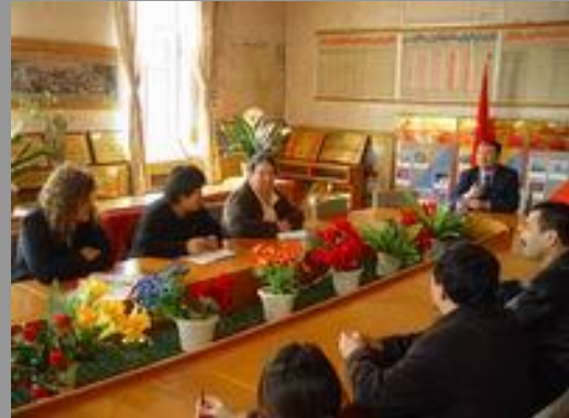
▲2003年3月20日下午，英国救助儿童会一行5人来到乌鲁木齐市第14中学（维吾尔族学校）了解下一阶段该校对预防艾滋病同伴教育的需求情况。