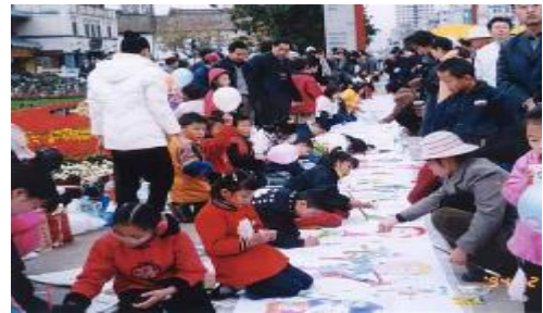
▲孩子们也拿起画笔加入到预防艾滋病的宣传行列中来

整个的艾滋病运动宣传活动中，各 NGO 都表现出极大的参与和互助精神，他们就象契合紧密的齿轮，使艾滋日活动作为一个整体运行得如此协调。或许，对于这个世界来说，艾滋病运动的意义也在于此——让人与人之间多一些和平友爱，让我们的社会更加和谐美好。