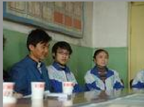
▲乌鲁木齐市第41中学是这次具体参与项目的一所试点学校。3月20日下午，该校专门组织参与过同伴教育活动的同学与英国救助儿童会座谈今后开展活动的愿望。