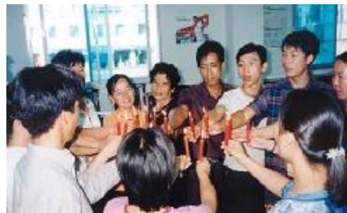
病人祝福 ← 志愿者们点燃红蜡烛，为艾滋

一年来，通过学习和实际接触这项工作，我亲眼目睹了瑞丽爱心诊所的工作人员所付出的艰辛和劳累。因为我们的培训面对的人群多半是流动人口，不仅语言难以沟通，而且他们所从事的行业特点使我们要来回数次，才可以确定他们能否参与健康教育培训。