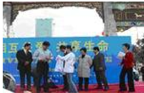
▲一件由百名志愿者签名的 T 恤被赠送给了濮存昕

就在各组织分头准备的时候，10 月 25 日，一项紧急的活动又摆在大家面前——著名演员濮存昕作为国家艾滋病义务宣传员主动与有关部门联系，表示愿意利用在昆明演出的空隙，在 28 日上午做一次公益活动，以配合昆明地区艾滋病宣传。消息传来时，离 28 日只有 3 天时间！这给本来就已任务繁重的各组织又增添了新的压力。可是工作人员们并没有被压倒，反而越发振奋，要知道这是多好一个机会呀！在这个时候他们的手握得更紧，不分时间地点，几家组织的工作人员在一起加班准备。