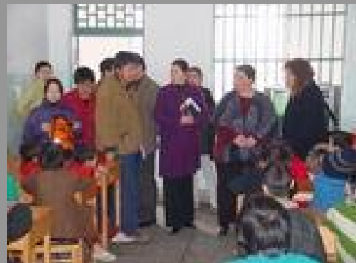
▲3月19日上午，救助儿童会社区健康项目组与儿童福利项目组一起来到新疆流浪儿童保护中心，为下一阶段两个项目共同合作对流浪儿童进行预防艾滋病教育进行前期调研。