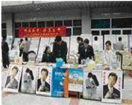
图为瑞丽市出入境检验检疫局的宣传展台

作的艾滋病预防和减少歧视的宣传材料色彩明快，文字通俗易懂，对群众具有很大的吸引力。很多路人主动前来索取宣传材料，提出问题。多数提问者在工作人员的详细解释后，都表示艾滋病固然可怕，但可以预防，应该给艾滋病病毒携带者和病人一个好的环境和氛围。也有少数人认为对于母婴传播和血液传播而感染的人是可以给予帮助和支持的；但那些由性传播感染的人则是咎由自取，是该受到惩罚的。可见，即使在瑞丽这个艾滋病工作开展得最早、最广的地区，长期的反对歧视宣传也依然是一项艰巨的任务。