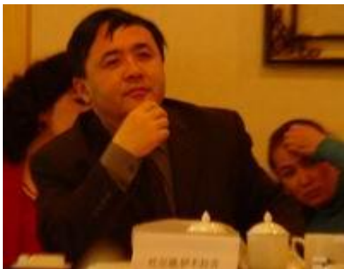
▲新疆维吾尔自治区政府办公厅秘书长吐尔逊·伊不拉音到会祝贺

6 开展一系列项目活动,包括在试点学校之间和校外开展活动,进而为校外青少年和流浪儿童提供艾滋病预防教育。