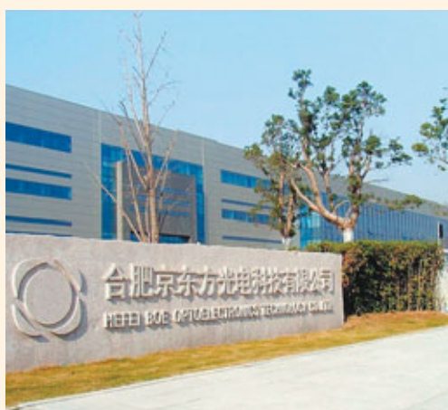
■ 合肥京東方是安徽發展戰略性新興產業的代表之一。

安徽將全面增強自主創新能力。加快合蕪蚌綜合試驗區和技術創新工程試點省建設，完善以企業為主體、市場為導向、產學研相結合的技術創新體系，形成更多的科技、產業、人才和改革成果，力爭社會研發投入、專利授權量、省級以上創新型(試點)企業數、高新技術產業總產值年均增長20%以上。把合蕪蚌綜合試驗區建成國內最具影響力的創新區域之一。