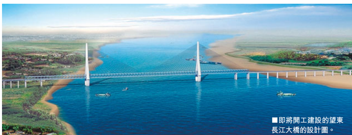
■ 即將開工建設的望東長江大橋的設計圖。

今年，安徽將進一步推進示範區建設。首先，加強開發區建設。促進開發區擴容升級、功能配套和體制機制創新，培育一批各具特色的專業化園區。其次，大幅提升承接產業轉移水平。第三，優化示範區發展環境。加快示範區融資平台和服務網絡建設，在金融、物流、海關、檢驗檢疫、用工等方面提供更好的服務和配套。第四，加快皖江示範區城鎮化建設，加快合肥經濟圈一體化發展步伐，把蕪湖、安慶等打造成產業層次較高、宜居宜業的區域中心城市。