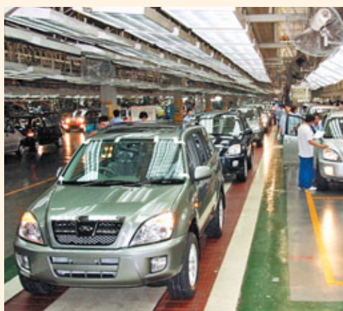
■ 奇瑞汽車是安徽自主創新的代表之一。