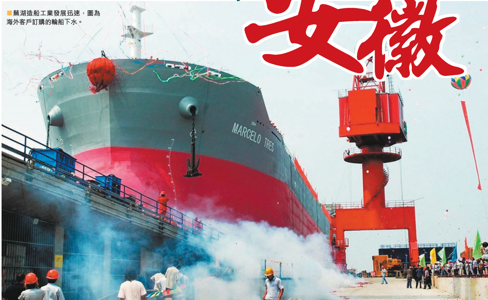
■ 蕪湖造船工業發展迅速，圖為海外客戶訂購的輪船下水。