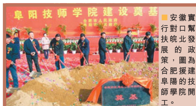
■ 安徽實行對口幫扶皖北發展的政策，圖為合肥援建阜陽的技師學院開工。