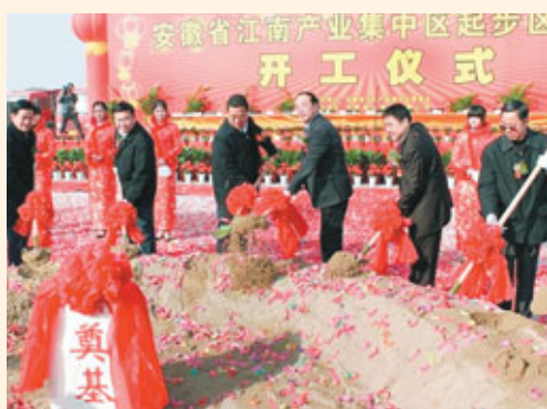
■ 安徽江南集中區開工建設。