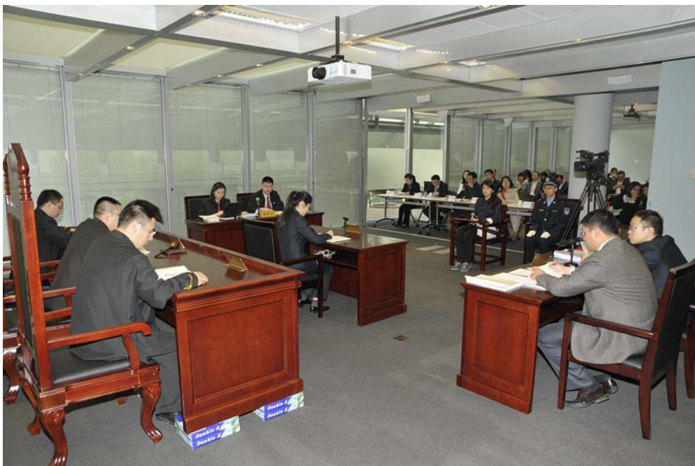
左图：模拟法庭现场 右图：合议庭成员