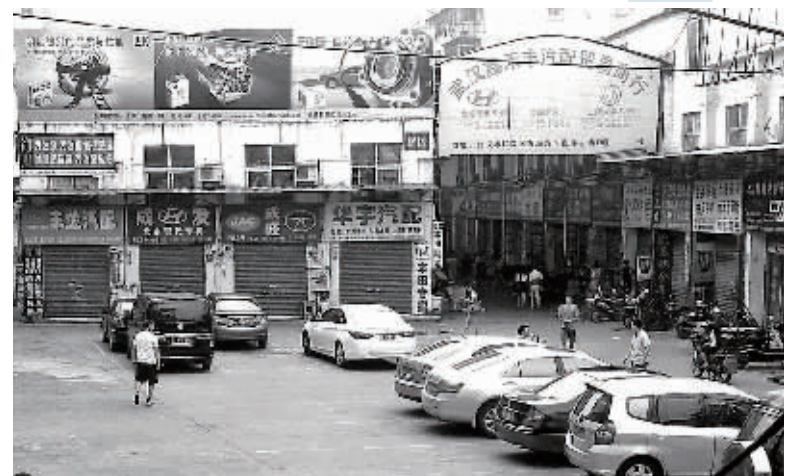
听信“打假”传闻，武汉汽配城商铺纷纷拉下了卷帘门。