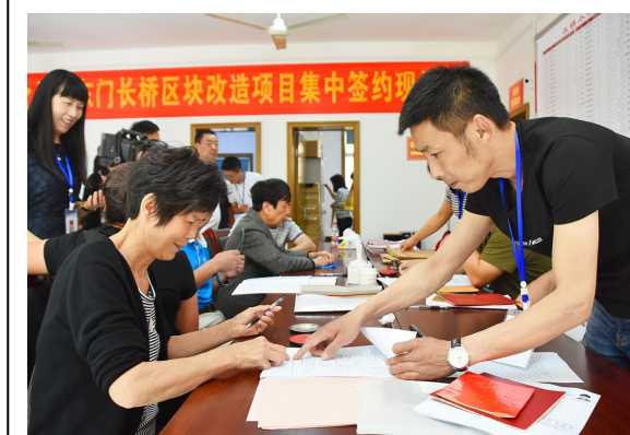
集中签约现场