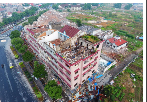
青龙区块改造项目城标段沿街店面昨日全部拆除。