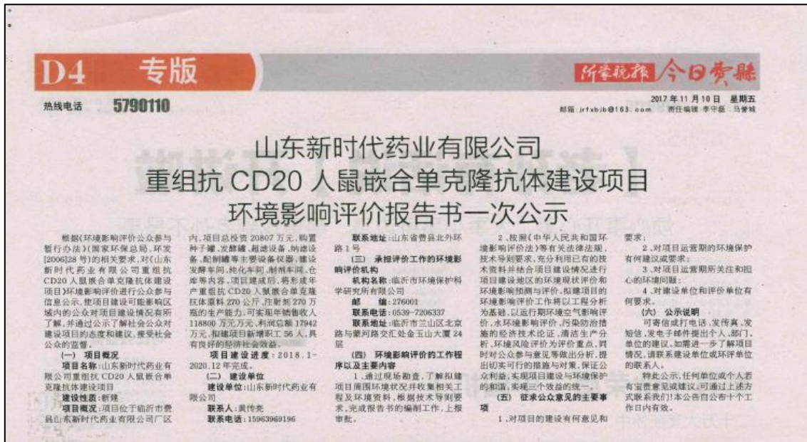
图 1 项目第一次报纸公示截图