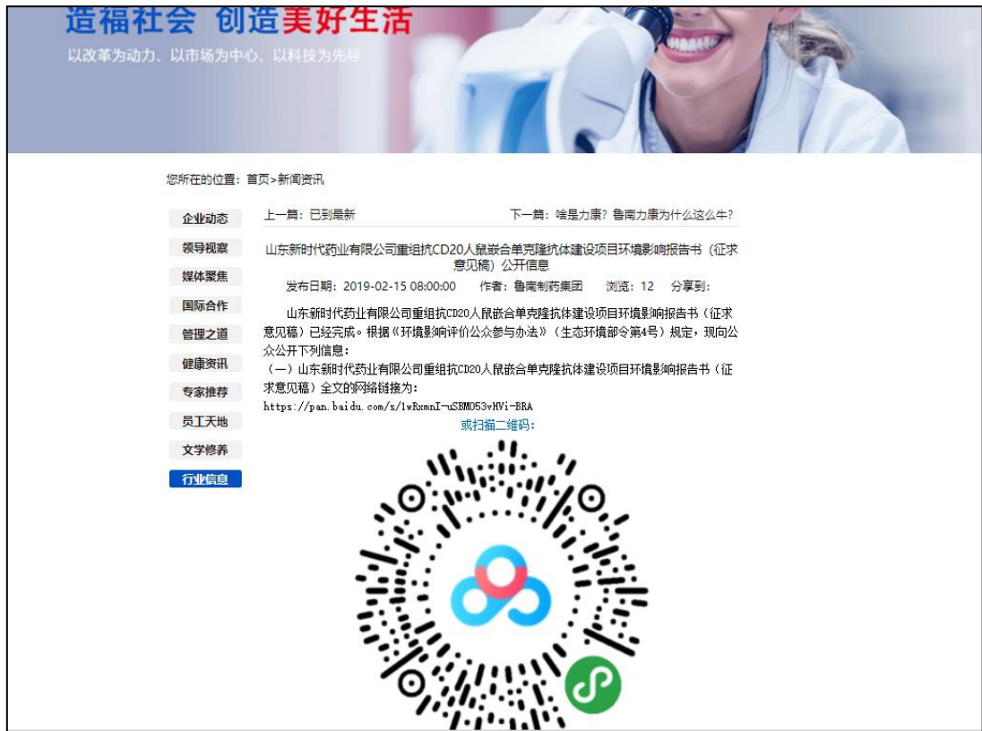
图 3 项目第二次网站公示截图