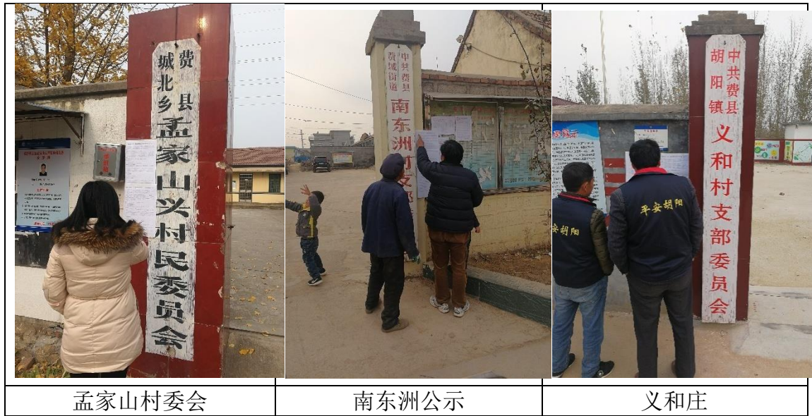
图 2 项目第一次公示周围村庄张贴照片