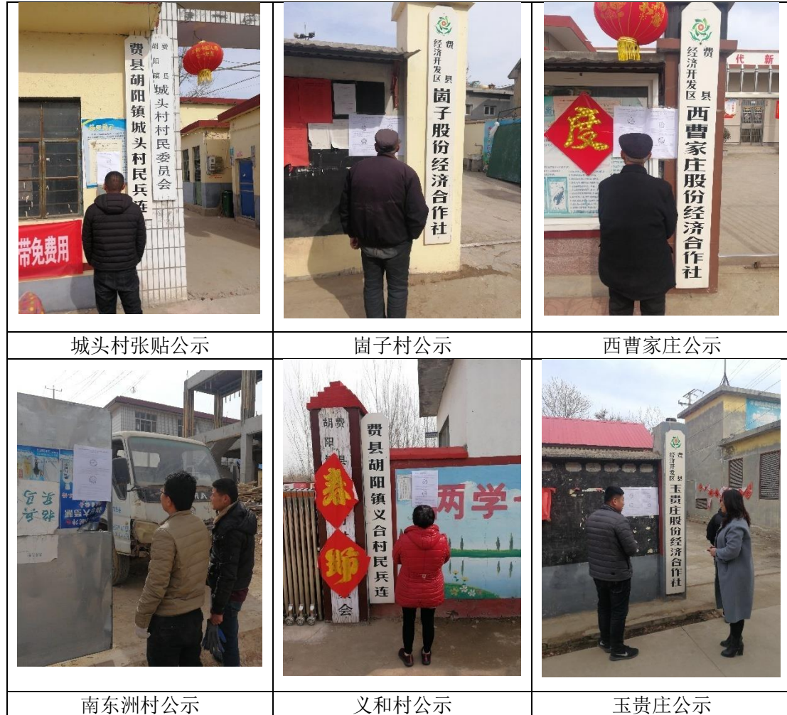
图 4 项目第二次公示周围村庄张贴照片