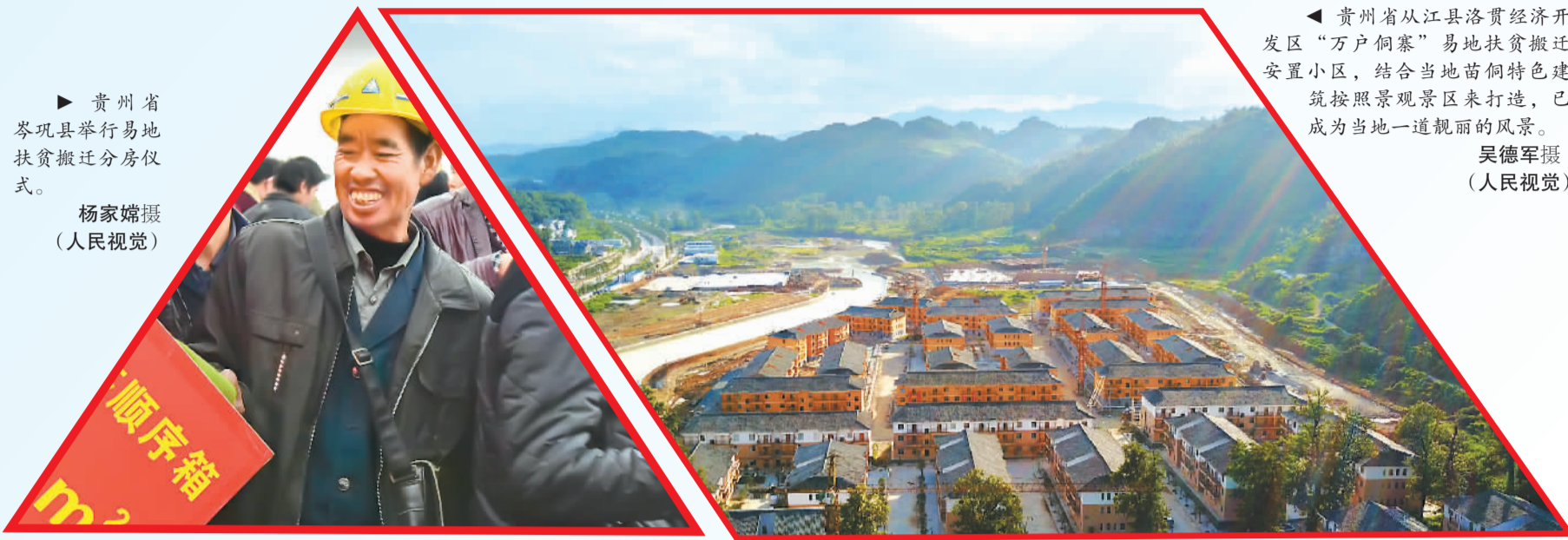
► 贵州省岑巩县举行易地扶贫搬迁分房仪式。

立多主体供给、多渠道保障、租购并举的住房制度，让全体人民住有所居。报告还从供应体系、保障体系、租赁市场三个方面对住房制度进行了完整的阐述，使“让全体人民住有所居”的目标有了更加明确的方向和实现路径。