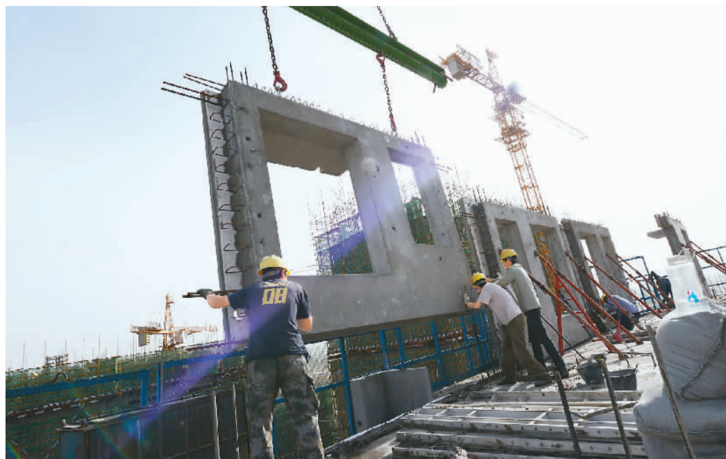
河南省郑州经开区滨河国际新城，建设了两栋24层高的装配式建筑，这两栋装配式建筑均是当地政府建设的保障房项目。“装配式建筑”比传统方式节约六成工期、近一半的人工，还能减少施工污染、保证施工质量。图为施工人员正在20层高楼上安装“预制夹心保温一体化外墙”。