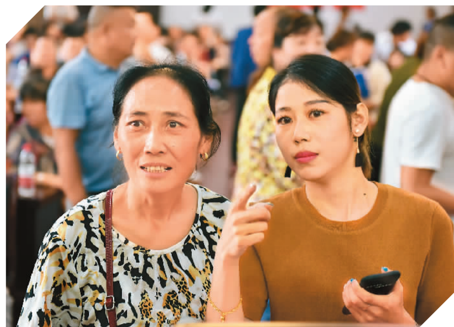
在安徽省巢湖市公共租赁住房实物配租公开选房现场，市民满怀期待地等待结果。当次配租的公租房共五百八十二套，备选房源与选房家庭的比例为一比一，符合准入条件的申请家庭分四天九个场次分别进行选房。