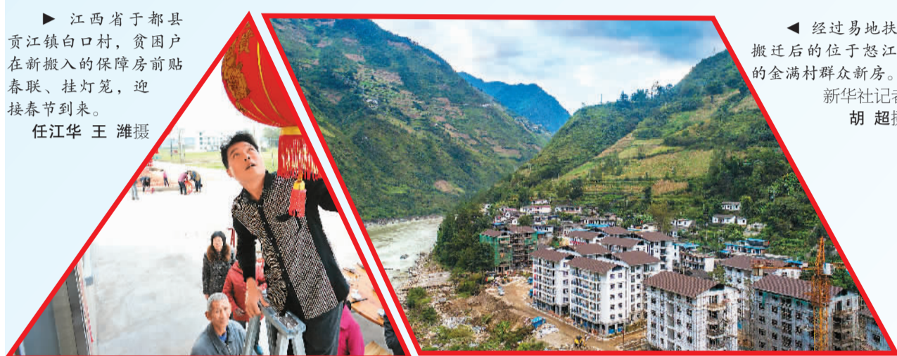
◀ 经过易地扶贫搬迁后的位于怒江边的金满村群众新房。