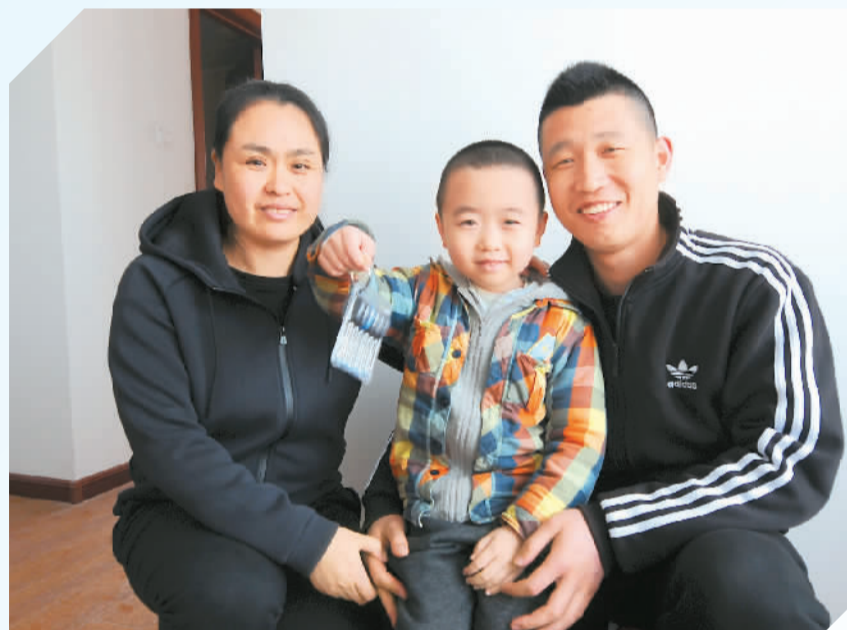
在山东省青岛市李沧区“海泊新城”，新入住的某市民一家三口在新居中喜拍全家福。当次配租的房源全部为精装修，并配有吸油烟机、打灶灶等厨房设施，最低月租价格仅三十五元，为多数住房困难的家庭减轻了经济上的压力。