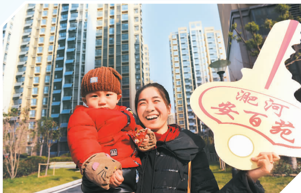
2月26日，安徽省合肥市包河区淝河镇老官塘社区、贾大郭社区、卫乡村的500多户“城中村”回迁居民通过抽号的方式选新房，入驻淝河镇刘衙城中村改造项目回迁小区安百苑B区。图为“城中村”村民拿到房屋“钥匙”，笑逐颜开。