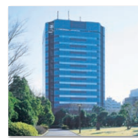
雅马拓材料本社 东京都江东区木场5-8-40 东京Park Side大厦14F

集团年销售额: 55.31亿人民币 集团员工人数: 1,296名 (2016年9月30日 1元/15.15日元)