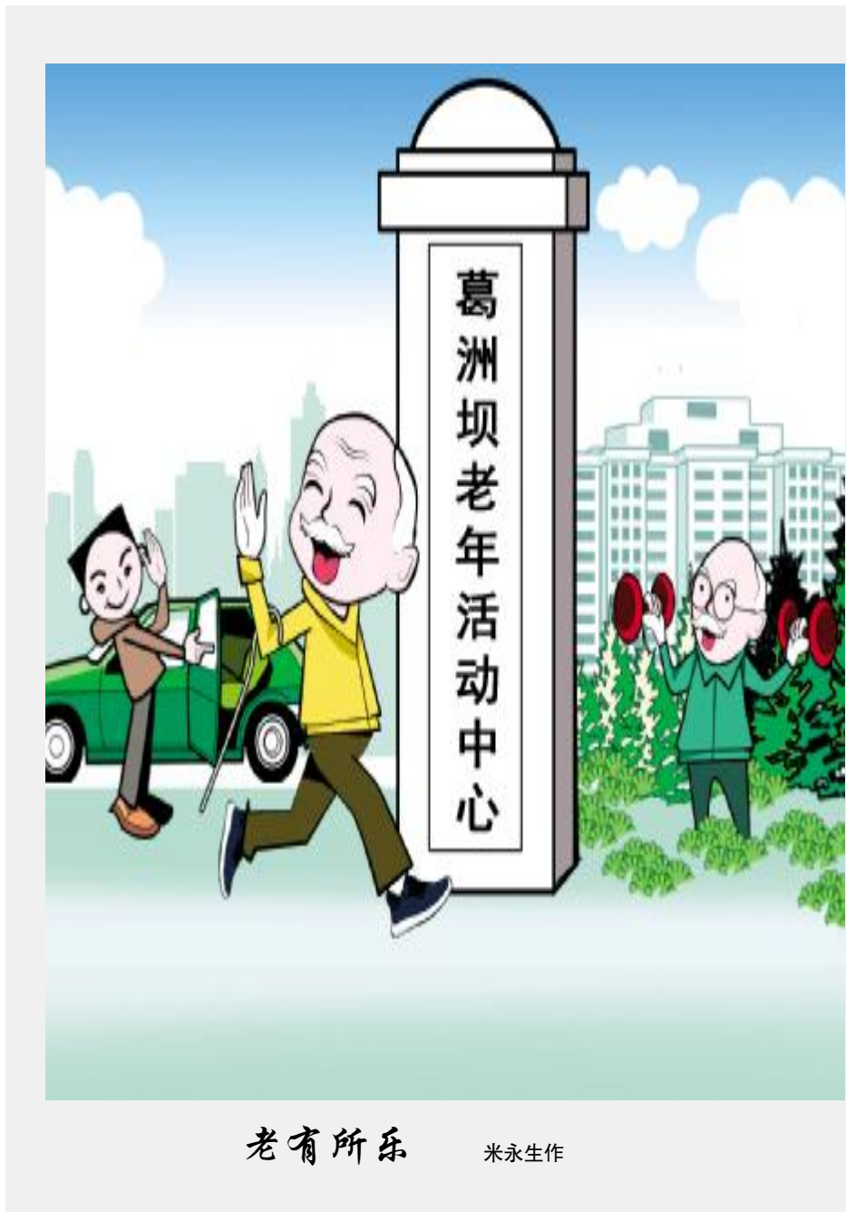
老有所乐 米永生作

住影响企业高质量发展的关键性问题,在攻坚克难上狠下功夫,发展不会一蹴而就,只有始终坚持问题导向,切实抓好打基础、创优势、利长远的大事要事,善于在工作中化解层层阻力,在解决制约高质量发展的深层次问题上取得重大突破,才能挖掘发展潜力,增强发展后劲,释放发展活力。 跑好高质量发展“接力赛”,就要强化责任担当。“伟大梦想不是等得来、喊得来的,而是拼出来、干出来的。”企业面临的挑战严峻复杂,改革发展任务艰巨繁重,各级领导班子和广大党员干部,一定要以昂扬向上的精神状态,创造新气象,展现新作为。应加强学习和调研,克服本领恐慌,在提高专业思维和职业素养上下功夫,干一行爱一行,钻一行精一行,管一行像一行。“以令率人,不若身先。”各级领导干部尤其要带头履职尽责,带头担当作为,带头承担责任,做到重点工作亲自部署、重大问题亲自研究、困难问题亲自帮助解决,落实情况亲自督察,企业上下和衷共济、团结一致,让干事创业在集团公司蔚然成风。 潮涌两岸阔,风正一帆悬。站在新时代的大背景下,高质量发展的目标已经确定,进军的号角已经吹响,我们坚信,有中国能建和集团公司的坚强领导,有全体党员干部的担当担责,有4万葛洲坝职工的齐心协力,葛洲坝一定能够跑好高质量发展“接力赛”,奔向更加美好、更加灿烂、更加辉煌的未来! (作者单位 五公司)