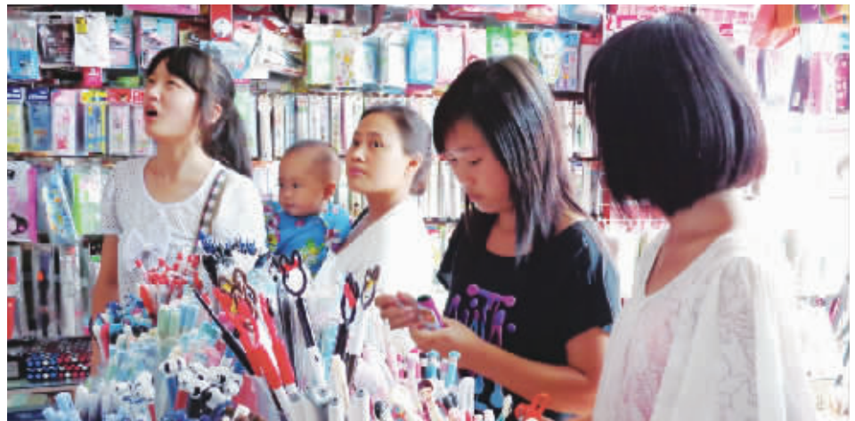
3年后开一家文具店,是胡先生的创业梦想。