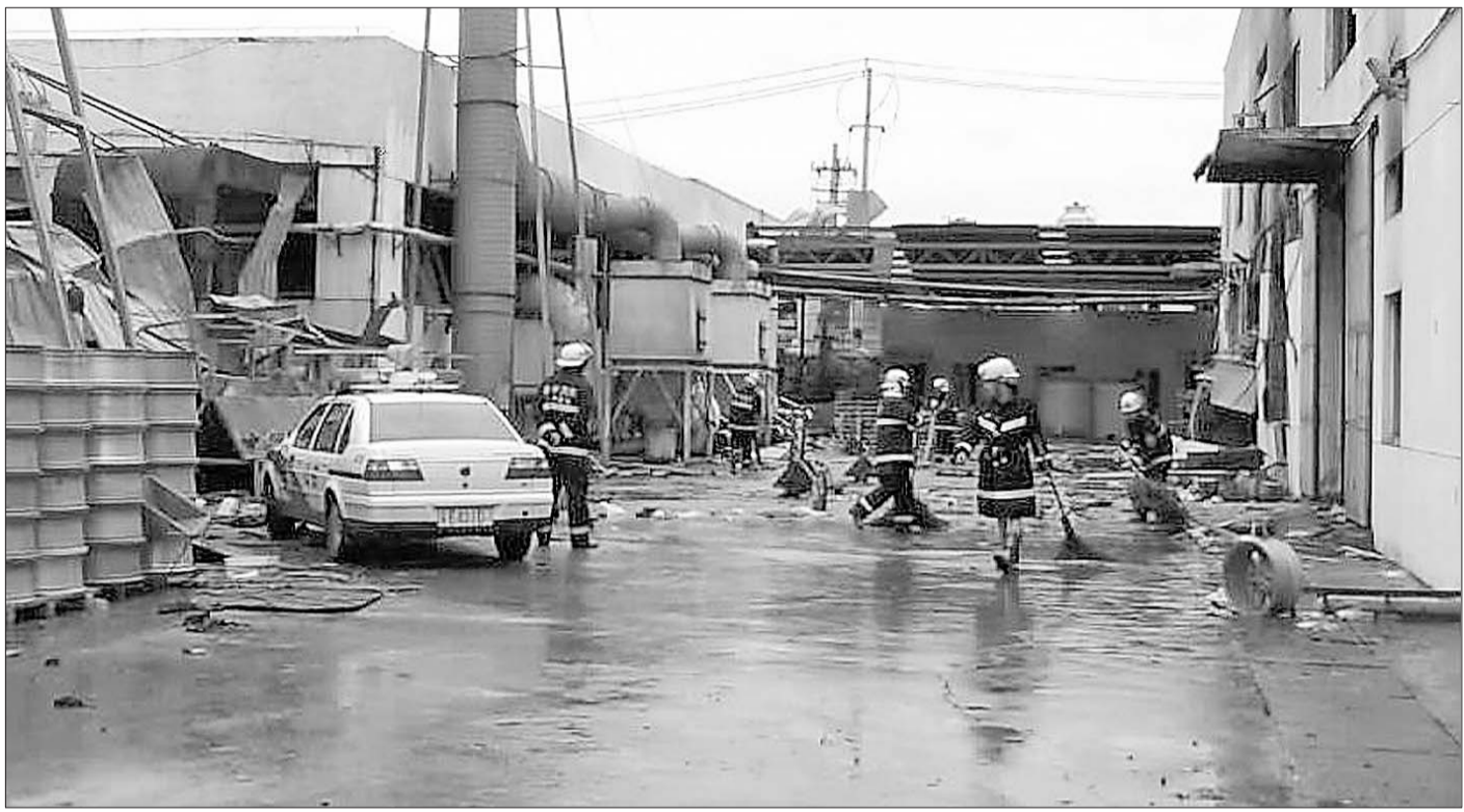
爆炸事故疑因粉尘引发。