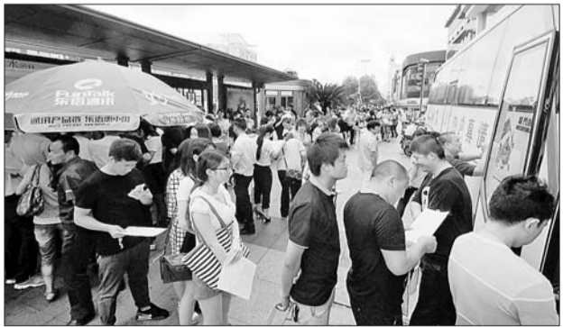
事故发生后，市民纷纷来到昆山各个献血点献血救治伤员。工作人员透露，当日昆山市内接受约400位市民献血，是往日的10倍左右。

国家卫计委指定的事故前方医疗专家组成员、上海瑞金医院烧伤科主任医师张勤沉痛地说：“我从事烧伤治疗长达27年，从未看到如此严重致命的爆震伤。送往医院的一些伤员已经离世，预计接下来死亡率会很高。”